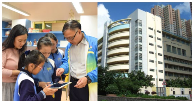
「不做書呆子」 愛秩序灣官小寓活動於學習 • 讓學生建立自主學習態度 《Oh! 爸媽》2018 年 12 月 13 日