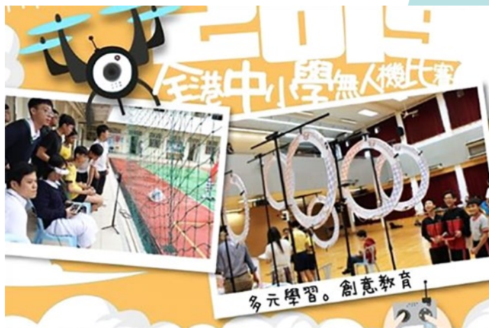
「多元學習 • 創意教育」2019 全港中小學無人機比賽 《SchoolLike 青協讚好校園》2019 年 05 月 10 日