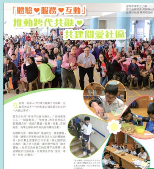
「小學長幼共融 • 建立關愛品格」 《香港經濟日報》2019 年 03 月 01 日