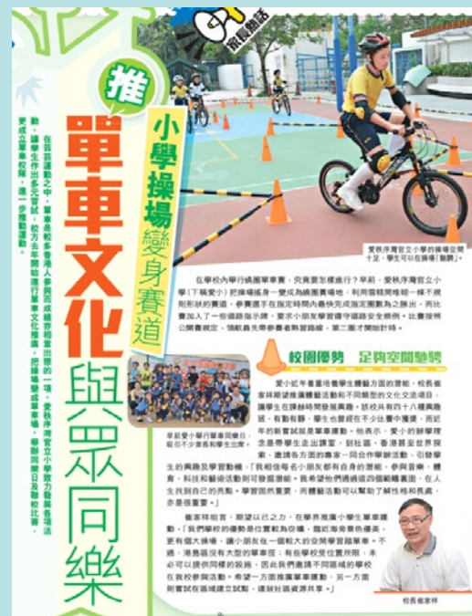
「小學操場變賽道推單車文化」 《星島日報》2018 年 12 月 06 日