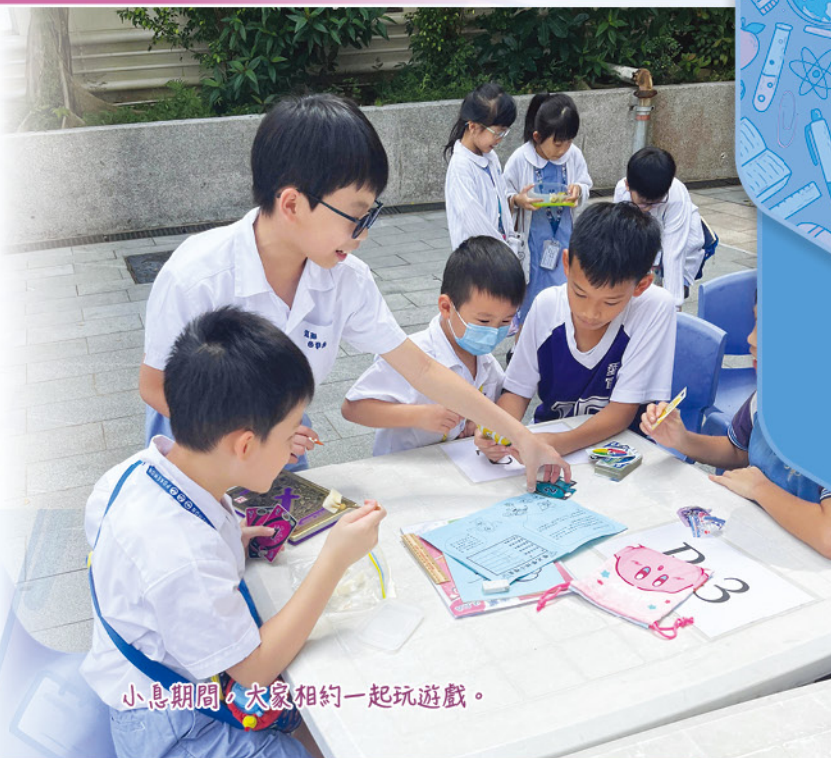
小息期間，大家相約一起玩遊戲。