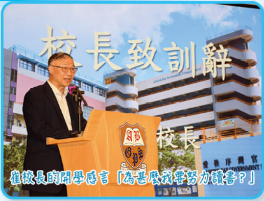
崔校長的開學感言「為甚麼我要努力讀書？」

最後，崔校長介紹了本學年新到任的老師，包括7位新老師及1位外籍英語老師，同時校內一些特別職務的員工亦與同學簡單見面，包括兩名學生輔導人員、言語治療師、駐校心理教家及兩名外籍英語老師。