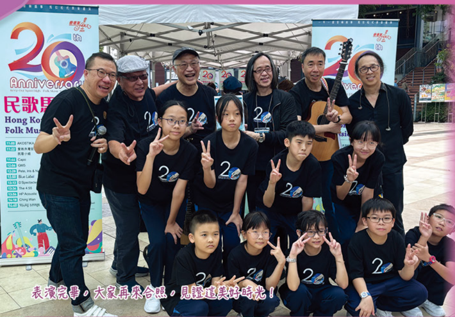
表演完畢，大家再來合照，見證這美好時光！

本校民歌小組同學已經第四年參加「民歌馬拉松」——一年一度盛大的民歌表演活動。而今年的「民歌馬拉松」已在二零二四年十一月二日赤柱廣場舉行，多名資深的民歌手到場表演，民歌小組同學有幸被邀請出席，以音樂作交流，同學們都獲益良多。