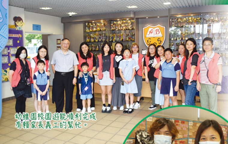
幼稚園校園遊能順利完成有賴家長義工的幫忙。

本校於二零二四年九月二十一日（星期六）舉辦了幼稚園校園遊，目的是讓區內外的幼稚園生及家長對本校有更深入的认识。當天的盛況空前，接近200個家庭報名參加。家長除可以透過參加簡介會認識本校的辦學理念外，學生更可以遊覽本校各項設施和參與我們的體驗活動，從而了解學校的環境和特色課程。