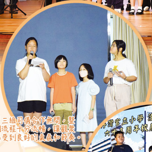
第三組司儀合作無間，整個流程十分流暢，讓觀眾感受到良好的氣氛和節奏。