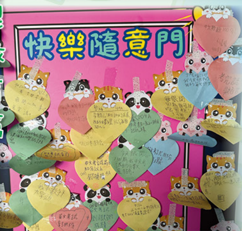
各班同學都積極在「快樂隨意門」上分享！

本年度亦推出了「快樂隨意門」計劃，讓學生於便利紙貼上記錄該星期遇到的快樂事件，然後貼於課室的「快樂隨意門」海報上。透過活動，讓同學多留意日常生活中的快樂及感恩事情，累積正向情緒，並互相分享，把快樂傳遞。