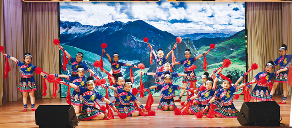
華麗的舞姿、動人的音樂，那就是我們中國舞校隊的同學！