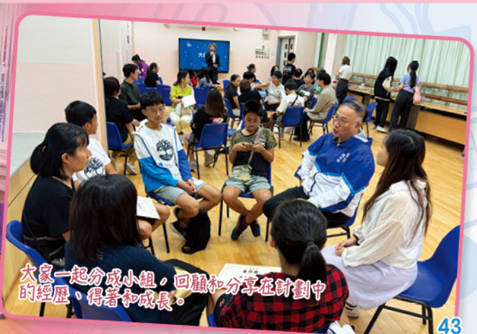
大家一起分成小組，回顧和分享在計劃中的經歷、得著和成長。