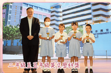
二年級至五年級英文學科獎