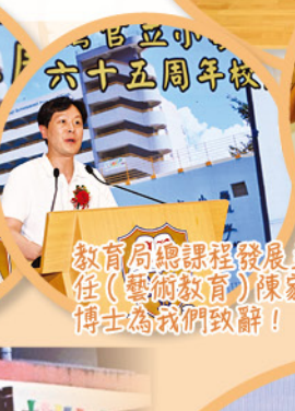
教育局總課程發展主任（藝術教育）陳家曦博士為我們致辭！