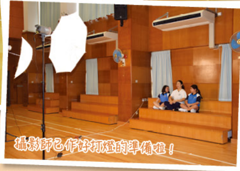
攝影師已作好打燈的準備啦！