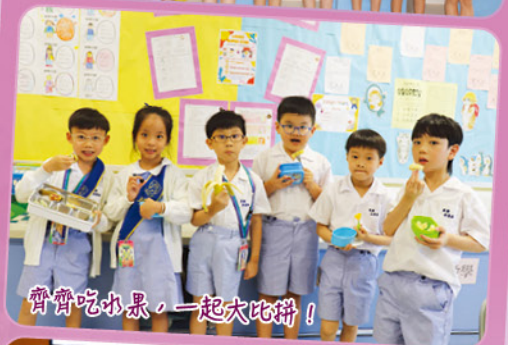
齊齊吃水果，一起大比拼！