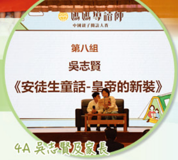
愛官的參賽家庭都展現十足的信心。

當天還舉行了「微笑彩虹·書香溫暖童年」公益捐贈活動，每間學校均獲贈一批課外書籍，讓同學可以增長課外知識，吸收中國文學的精髓。比賽後，同學們亦分享了自己的感受，他們均表示與父母一起閱讀提升了他們對閱讀的興趣，過程中他們能與父母互相表達意見，收獲了滿滿的快樂和回憶。愛官的媽媽們更表示十分開心能與子女一同閱讀故事，與孩子分享故事的智慧，引導孩子思考人生與世界，塑造他們的人生觀和價值觀，讓親子關係更緊密。