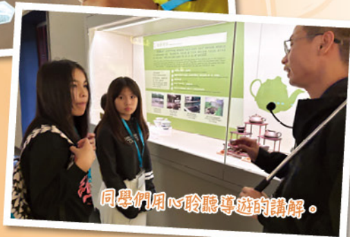
同學們用心聆聽導遊的講解。