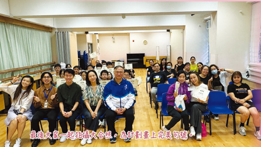
最後大家一起拍攝大合照，為計劃畫上完美句號。