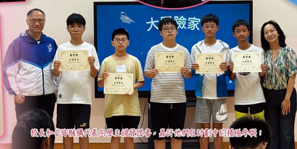
校長和合作機構代表向學生頒發證書，嘉許他們在計劃中的積極參與！