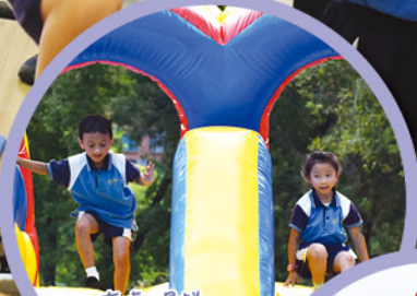
充氣滑梯，看誰滑得快。