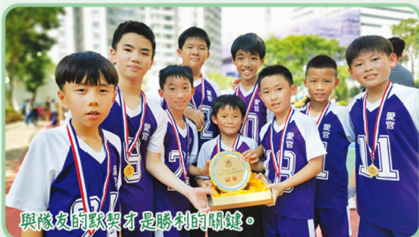
與隊友的默契才是勝利的關鍵。

在此，感謝家長到場支持和鼓勵，見證孩子在球場上展現出無比的鬥志和拼搏精神。期望他們繼續累積比賽經驗，於往後賽事有更出色的表現。