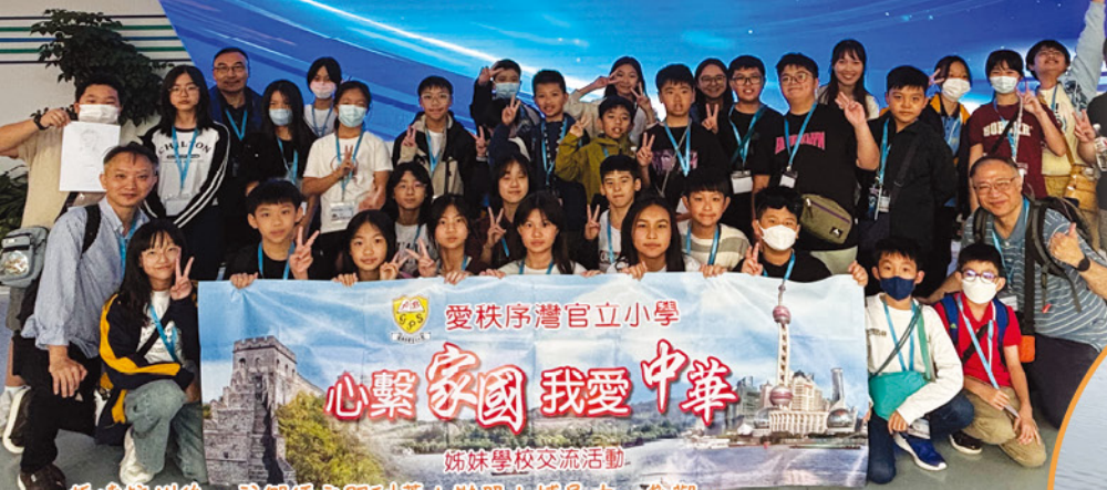
抵達杭州後，我們便立即到蕭山機器人博展中心參觀。