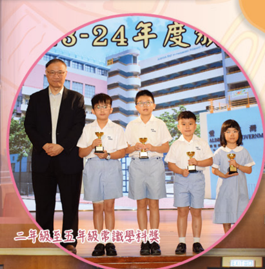
二年級至五年級常識學科獎