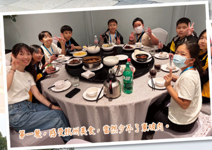
第一餐，感受杭州美食，當然少不了東坡肉。