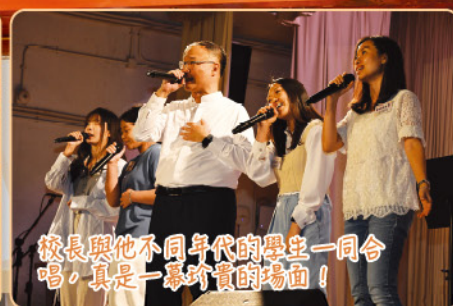
校長與他不同年代的學生一同合 唱，真是一幕珍貴的場面！