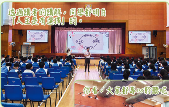
透過講者的講解，同學都明白「人生是有選擇」的。