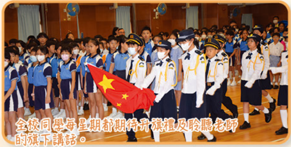
全校同學每星期都期待升旗禮及聆聽老師的旗下講話。

本校每週舉行一次升旗禮及旗下講話，全校師生一同參與，透過升旗禮及旗下講話，讓同學們學會升旗禮的禮儀，加強他們對國家、國旗和國歌的尊重，培養對國民身份的認同。校長和老師會藉着旗下講話分享國家安全的知識、中國現今的發展和傳統文化，加深學生對國家的認識及中華文化的欣賞，從而增強對國家的歸屬感。