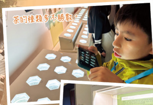
茶的種類多不勝數。