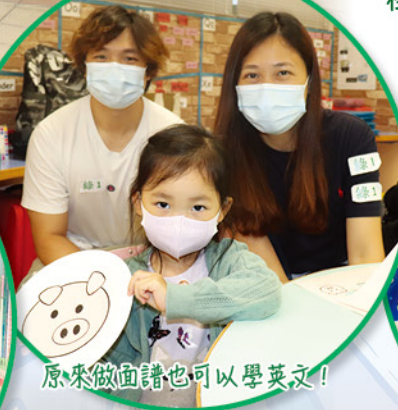
原來做面語也可以學英文！