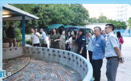
大家到音樂天地、創客室及自然教育中心參觀。