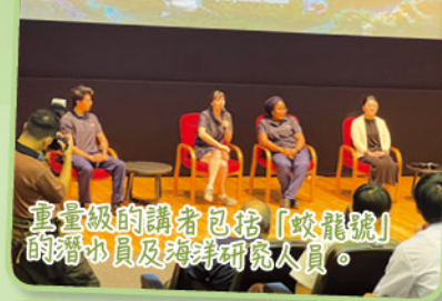
重量級的講者包括「蛟龍號」的潛水員及海洋研究人員。

同學有幸參加了關於「蛟龍號」數字化深海典型生境國際研討會，蛟龍號是中國自主研發的深海潛水器，擁有世界領先的深潛技術，能夠探索海洋的深處，對於海洋科學研究具有重要意義。通過這此活動，大家對深海科學和技術有了更深刻的認識。蛟龍號不僅是一項技術成就，更是科學探索的重要工具，幫助我們揭開海洋的奧秘。此次研討會不僅拓寬了同學們的視野，也鼓勵他們在未來的學習中勇於探索，追求卓越。