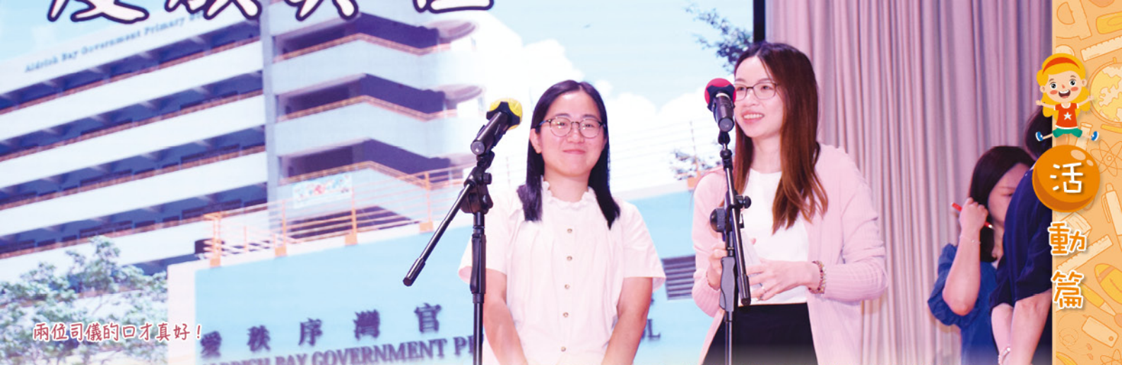
兩位司儀的口才真好！