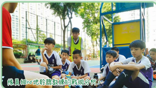
隊員細心地聆聽教練的戰術分析。