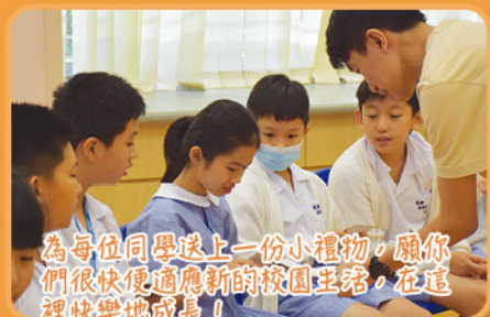
為每位同學送上一份小禮物，願你們很快便適應新的校園生活，在這裡快樂地成長！