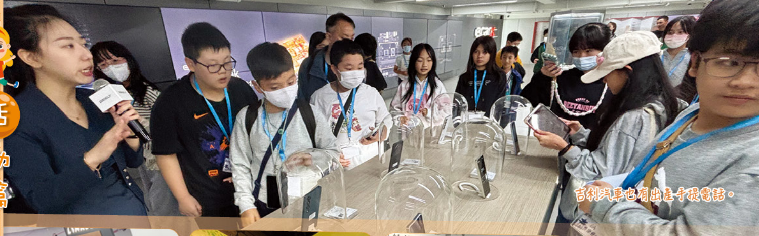
吉利汽車也有出產手提電話。