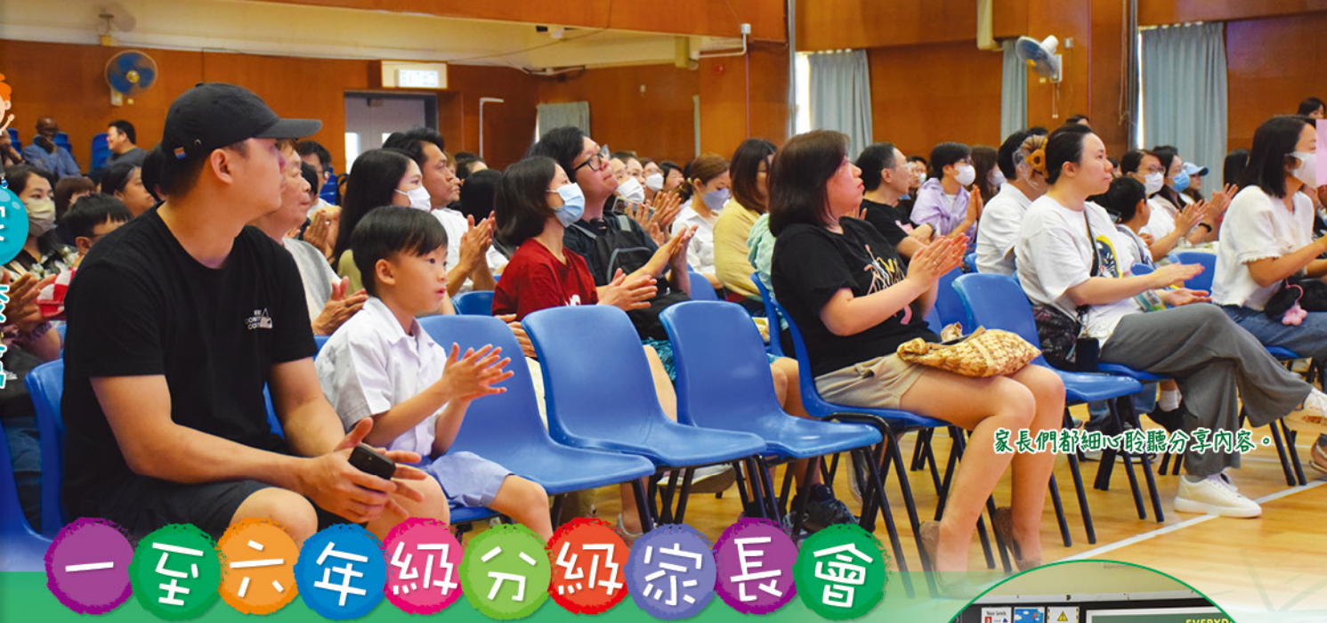
家長們都細心聆聽分享内容。