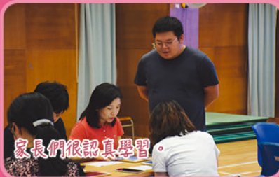
家長們很認真學習。