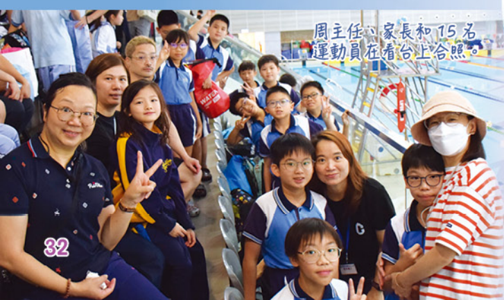
周主任、家長和 15 名運動員在看台上合照。