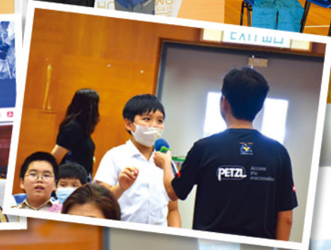
同學們對袁先生的分享都甚感興趣，積極發問！