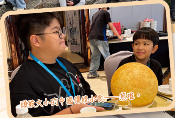
頭般大小的中國傳統小食——煎堆。