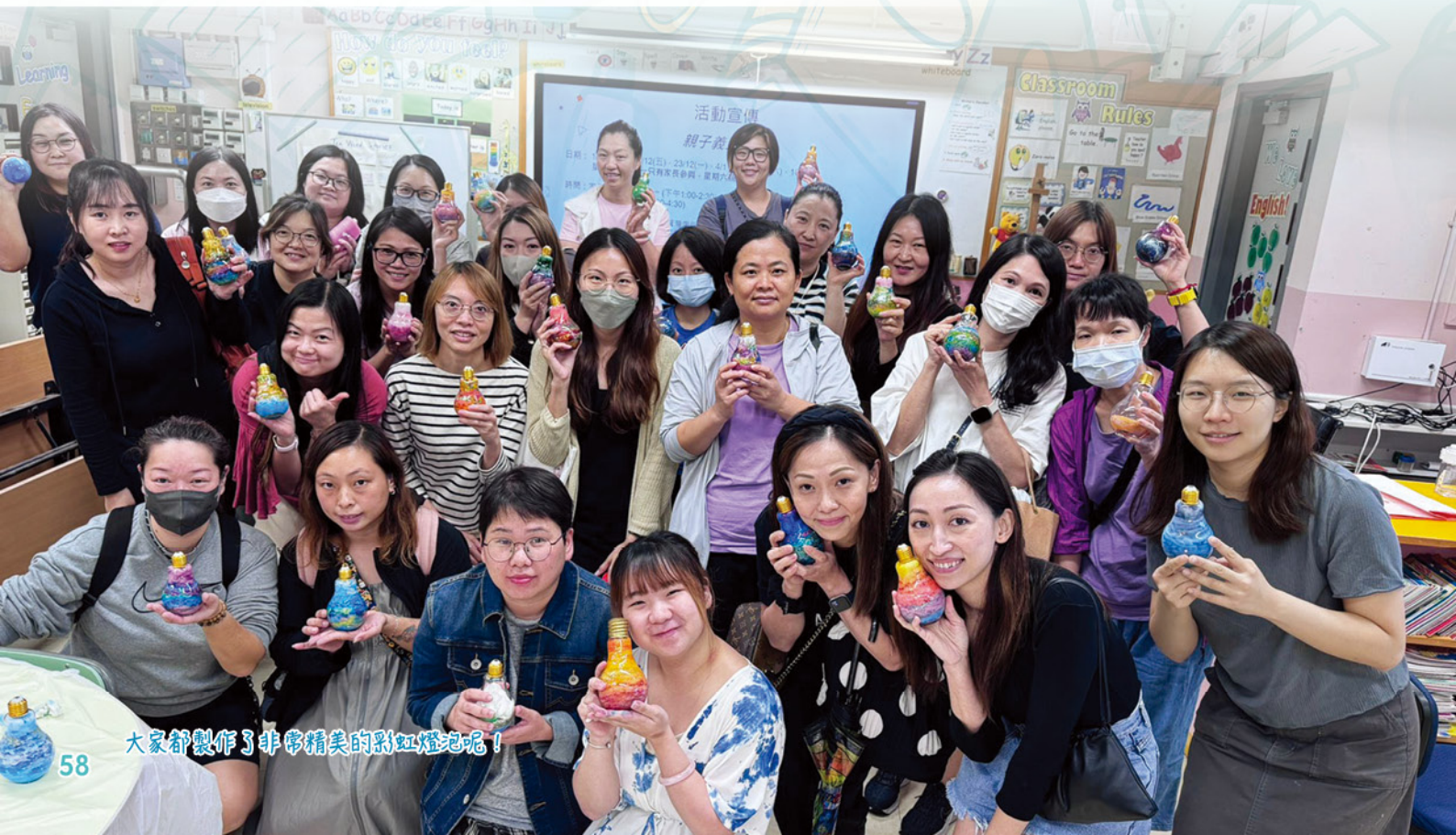
大家都製作了非常精美的彩虹燈泡呢！