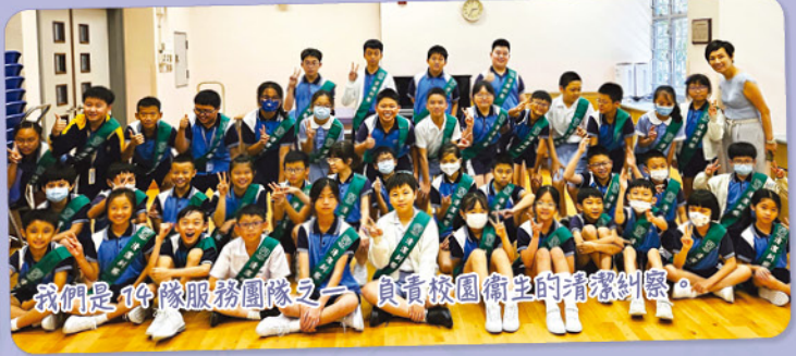
我們是 14 隊服務團隊之一——負責校園衛生的清潔糾察。