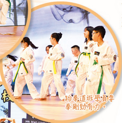
跆拳道班學員要拳剛勁有力。