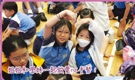
姐姐和學妹一起做愛心手勢！