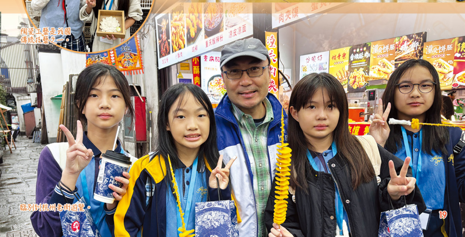
臨別到杭州老街遊覽。