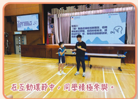
在互動環節中，同學積極參與。

二零二四年九月二十五日（星期三）同學參加了禁毒講座。這次「無毒新世代」講座是由保安局禁毒處委託九龍樂善堂舉行，目的是培養學生的抗毒意識，鼓勵他們追求健康生活方式，使同學具備在任何地方拒絕吸毒、應對同儕壓力的能力，避免墮入毒品陷阱。