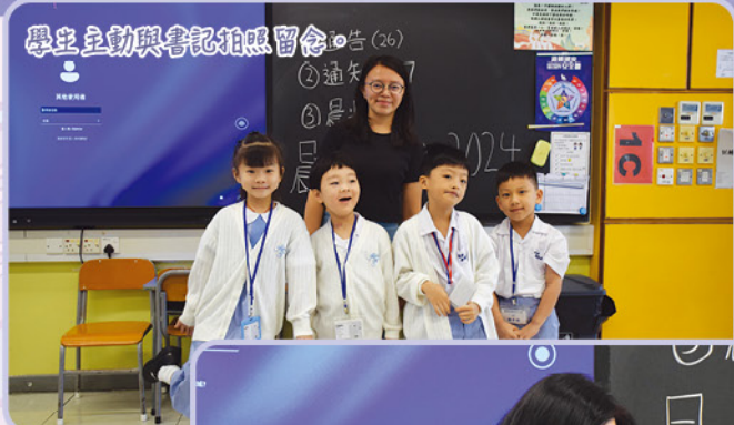
學生主動與書記拍照留念。