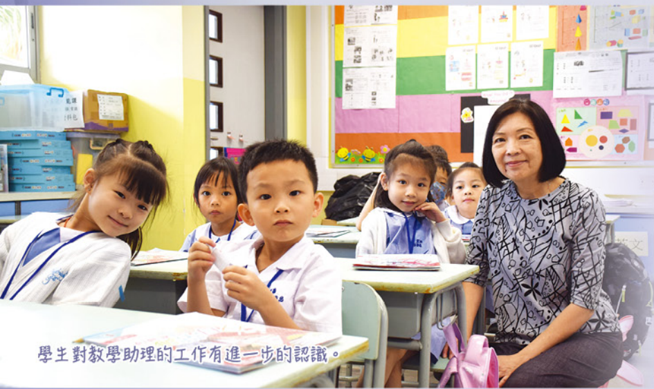
學生對教學助理的工作有進一步的認識。

本校安排一年級學生進行「學校是個大家庭」訪問活動，學生可以準備感興趣的問題向學校成員進行訪問，當中包括校長、書記、教學助理及校工，讓學生進一步認識學校成員的不同職責，亦協助一年級學生融入愛官的大家庭。