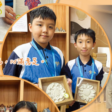
看見自己的製成品，心滿意足。