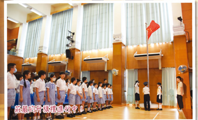
莊嚴的升旗禮進行中！