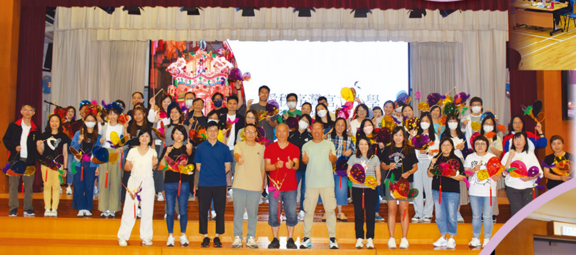
教師發展日完滿結束，大家一起合照。