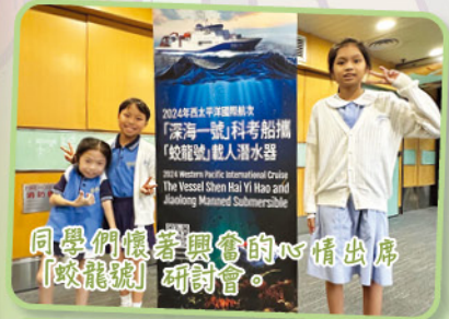
同學們懷著興奮的心情出席「蛟龍號」研討會。