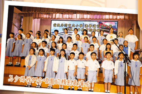
怎少得我們合唱團的精彩表演呢！