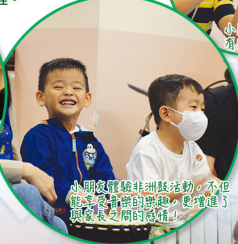
小朋友體驗非洲鼓活動，不但能享受音樂的樂趣，更增進了與家長之間的感情！