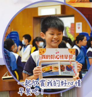
一起欣賞我的好心情早餐吧!