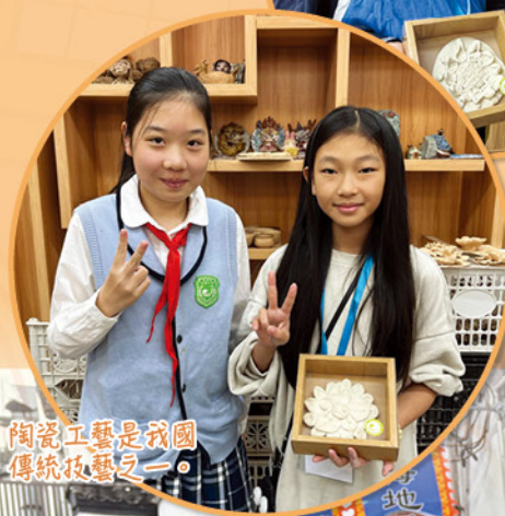
陶瓷工藝是我國傳統技藝之一。