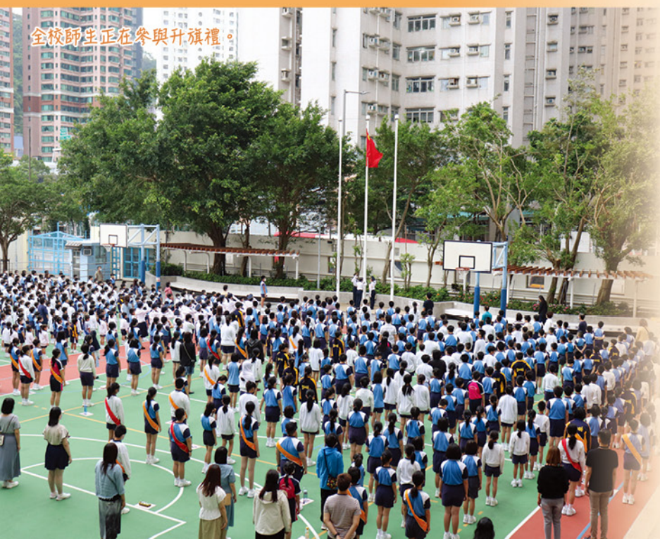
全校師生正在參與升旗禮。