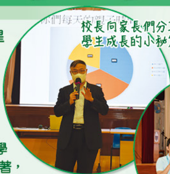
校長向家長們分享協助學生成長的小秘笈。

學校於二零二四年十月五日（星期六）舉行一至六年級的分級家長會。各科老師分享課程重點、學生應試表現分析及解決學生學習難點的建議，旨在幫助家長了解孩子學習狀況，從而更有效指導孩子。此外，家長亦與班主任會面，深入了解孩子在學校的表現。這次分級家長會的成效顯著，加強了家校合作，共同促進學生的學習與成長。