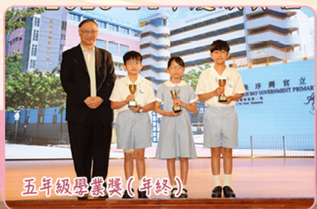
五年級學業獎(年終)