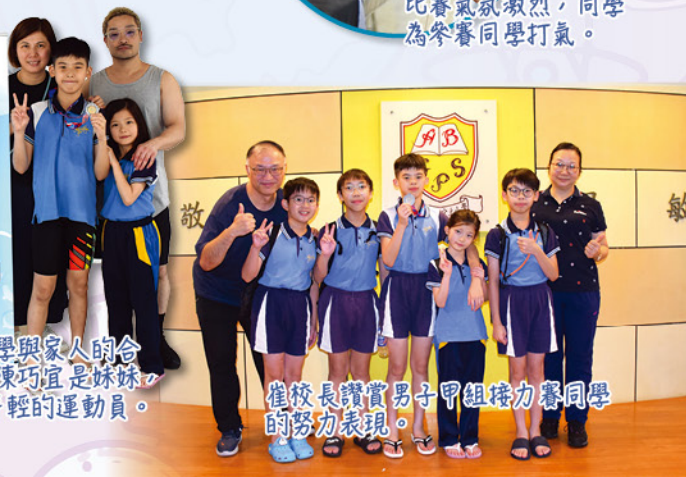
崔校長讚賞男子甲組接力賽同學的努力表現。