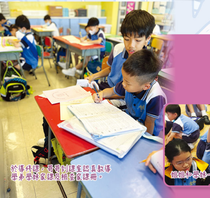
於導修課，哥哥到課室認真教導學弟學妹家課及檢查家課冊。