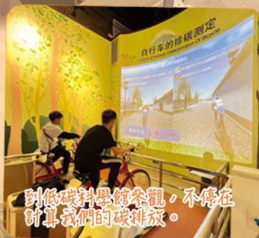
到低碳科學館參觀，不停在計算我們的碳排放。