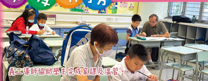
義工導師協助學生完成家課及溫習。

本年度繼續與香港仔坊會尚融林基業中心合辦「童學輕鬆天地課後支援服務」及「提升英語基礎班」，由義工導師協助指導學生，以一對一的形式進行功課輔導及學習英文，義工導師亦會因應學生的學習進度及情況協助學生溫習課本，以培養學生的責任感、善良品格及自律性。