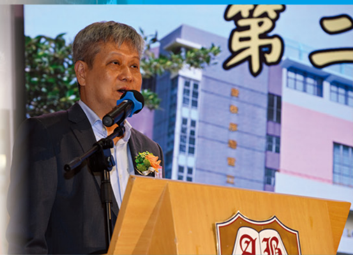
主禮嘉賓香港電子科技商會名譽主席葉劍誠先生向畢業生致詞。

六月二十九日(星期六)一大清早,同學們就精神抖擻地返回學校,為畢業典禮作最後準備,心情既緊張,又興奮!今年的畢業典禮,除了頒發畢業證書及各個獎項外,畢業典禮的尾聲,全體同學獻唱了「良師頌」、「Today」及「友共情」,憑歌寄意,感謝及感恩老師及家長一直以来的支持。各位觀眾都看得十分投入、如癡如醉呢!畢業典禮在一片溫馨動人、熱鬧歡愉的氣氛下圓滿完成。祝願全體畢業同學前程錦繡,開展康莊豐盛的中學生活及人生坦途!