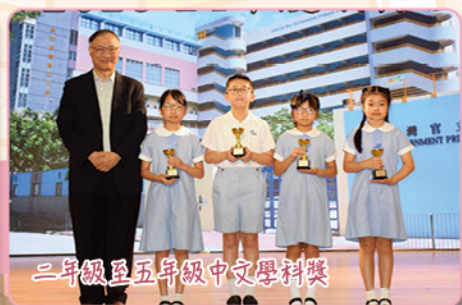
二年級至五年級中文學科獎