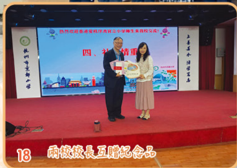
18 兩校校長互贈紀念品