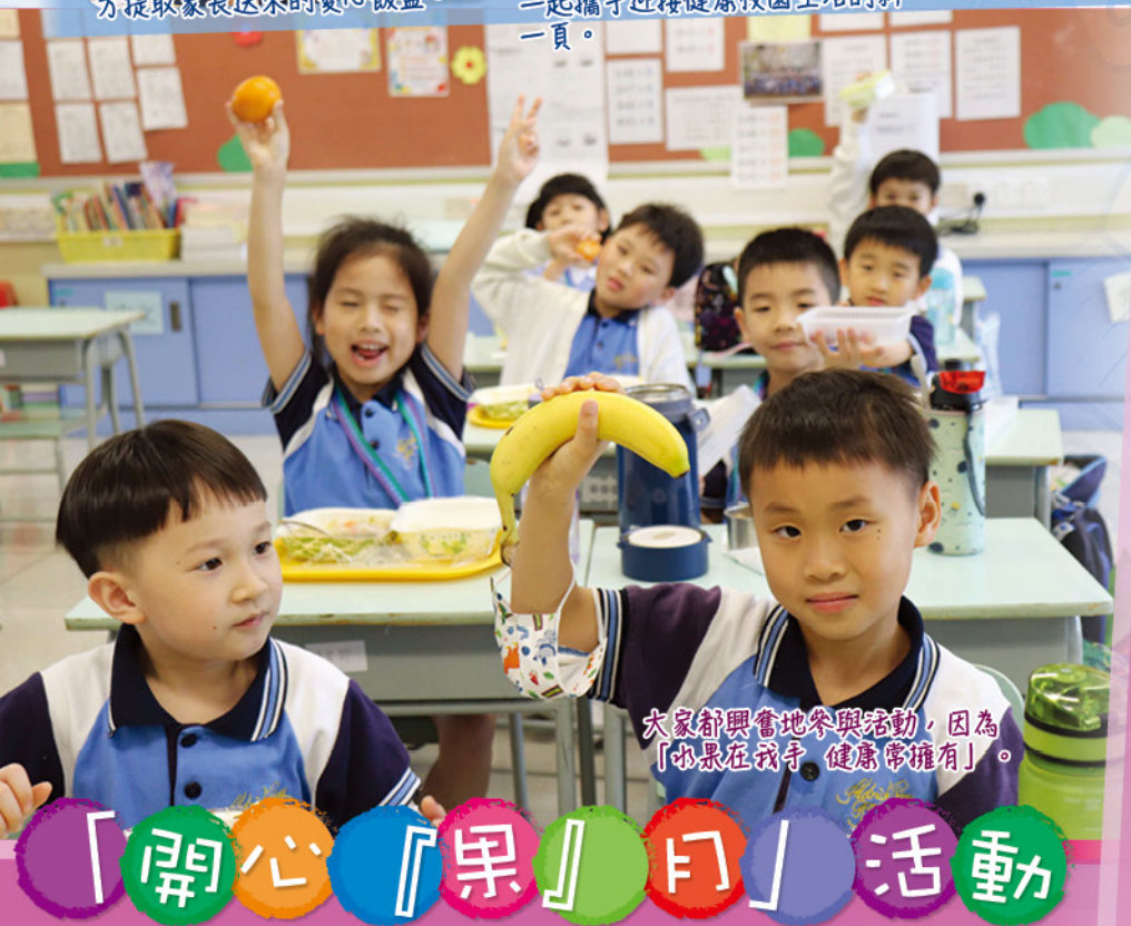
大家都興奮地參與活動，因為「水果在我手，健康常擁有」。