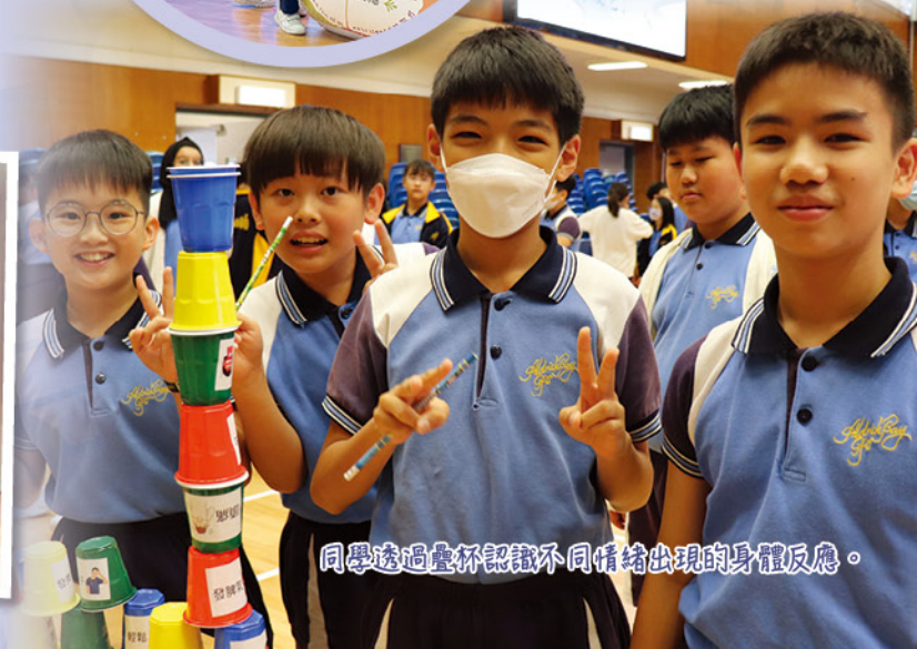
同學透過疊杯認識不同情緒出現的身體反應。