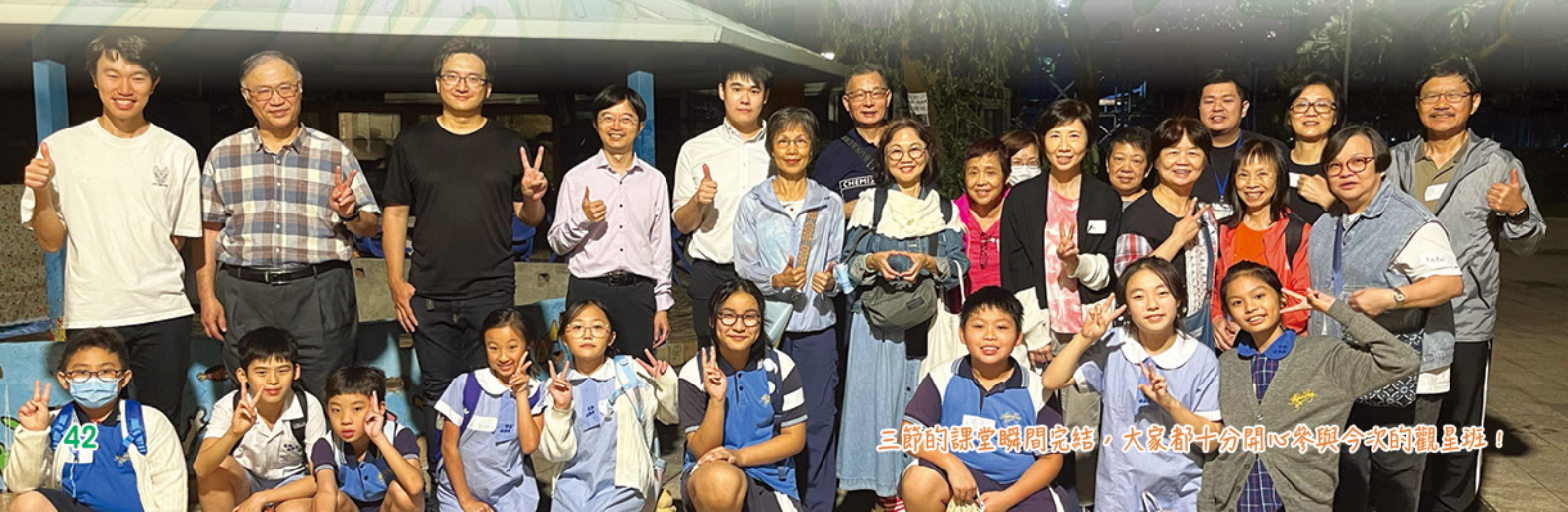
三節的課堂瞬間完結，大家都十分開心參與今次的觀星班！