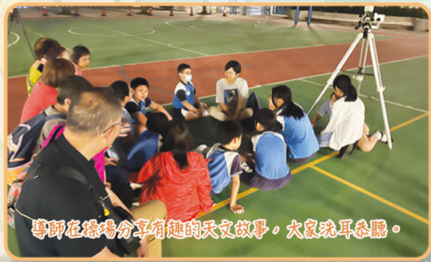
導師在操場分享有趣的天文故事，大家洗耳恭聽。