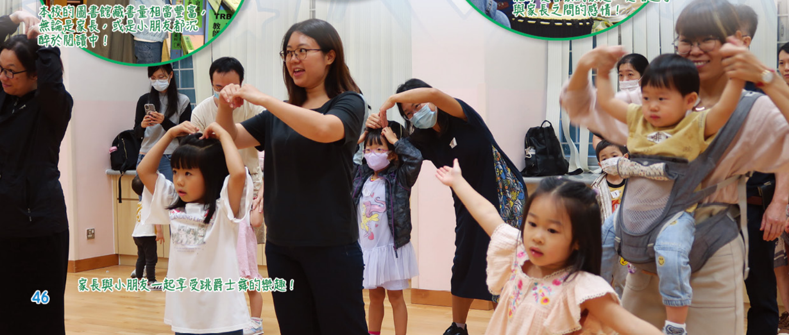
家長與小朋友一起享受跳爵士舞的樂趣！