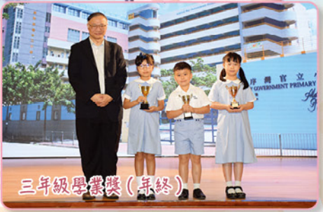
三年級學業獎(年終)