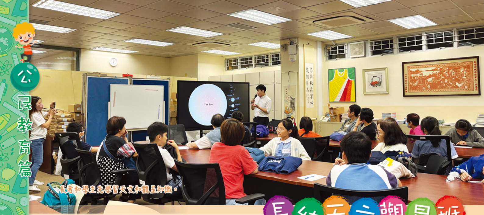
長者和學生先學習天文和觀星知識。