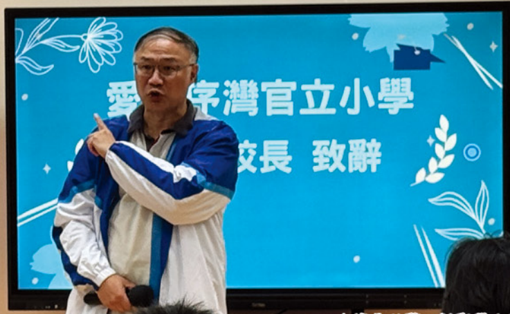
由校長致辭，勉勵學生繼續努力向夢想進發，並為結業禮掀起序幕。