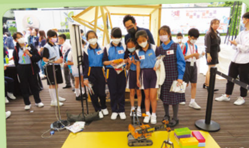
同學們到訪多個政府部門，學習與城市規劃有關的設施。