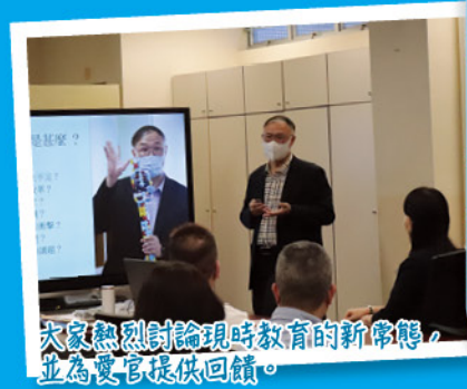
大家熱烈討論現時教育的新常態，並為愛官提供回饋。

八間官小校長及主任於二零二四年十月四日（星期五）到訪愛官。校長及主任們與大家分享愛官的人事及行政管理經驗，並安排參觀課外活動及校園特色課室。大家一起交流了教育心得，獲益良多。八間官立小學分別是：佐敦道官立小學、觀塘官立小學、李陞小學、大埔官立小學、黃大仙官立小學、粉嶺官立小學、嘉道理爵士官小學、將軍澳官立小學。