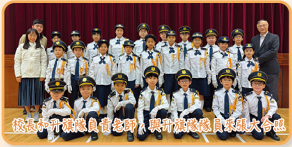
校長和升旗隊負責老師，與升旗隊隊員來張大合照