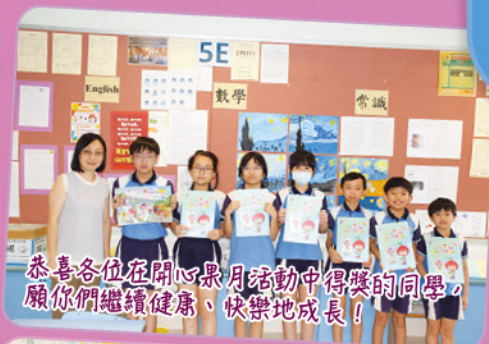
恭喜各位在開心果月活動中得獎的同學，願你們繼續健康、快樂地成長！