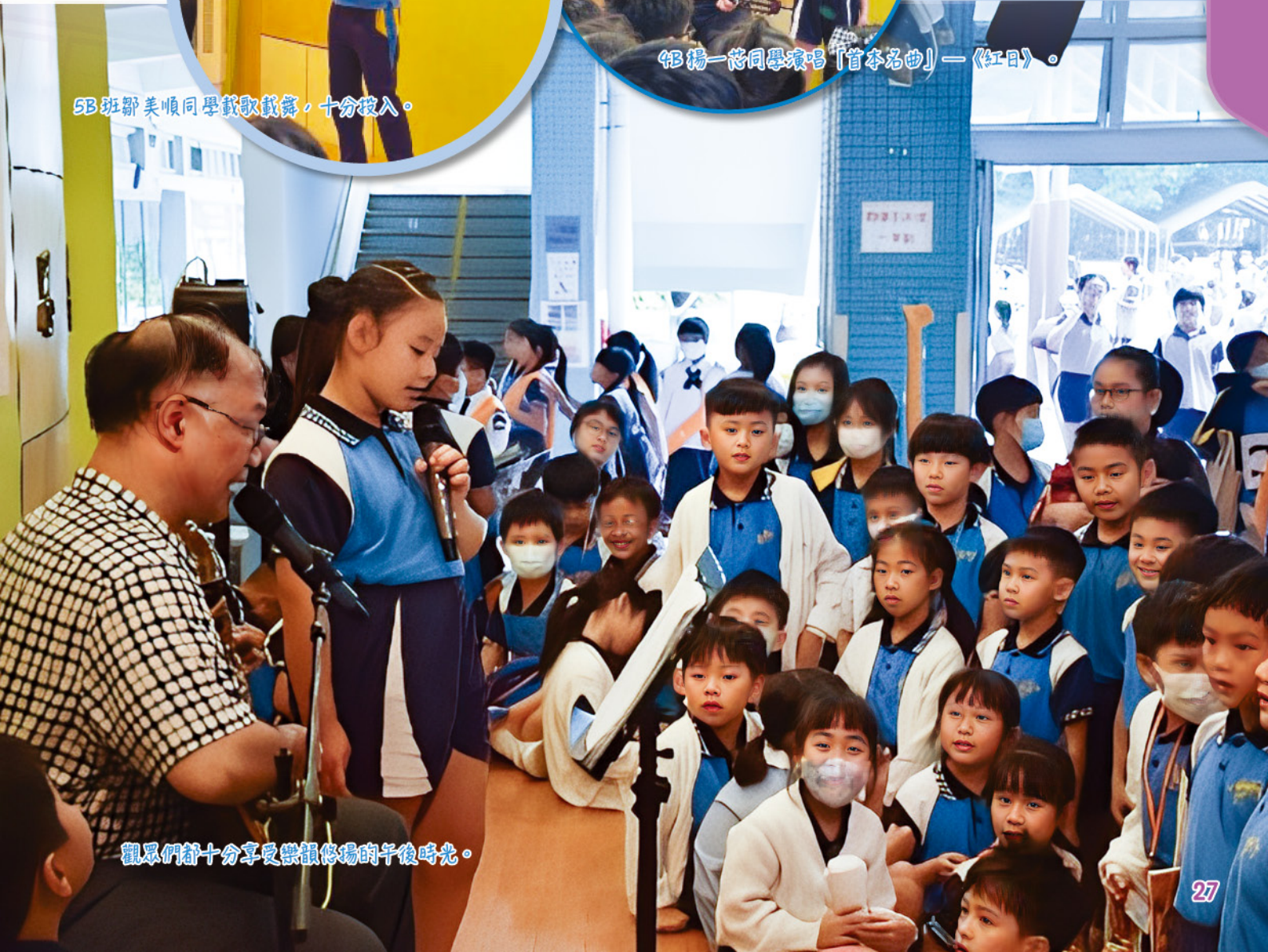
觀眾們都十分享受樂韻悠揚的午後時光。