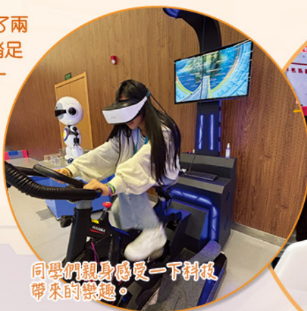
同學們親身感受一下科技帶來的樂趣。

去年，杭州京都小學到訪本校，開啟了兩校交流的序幕，今個學年初，我們便首次踏足杭州到訪這所建在運河旁的校舍。十月三十日（星期三）我們到西湖乘船遊覽，感受西湖山水秀麗之美。十月三十一日（星期四），我們便到訪杭州京都小學，得到了校長的及師生們熱情的接待，兩校同學均有表演環節，除了參觀校園外，同學們兵分兩路，與京都小學的同學們一同上陶藝課或板畫課，讓同學們大開眼界。