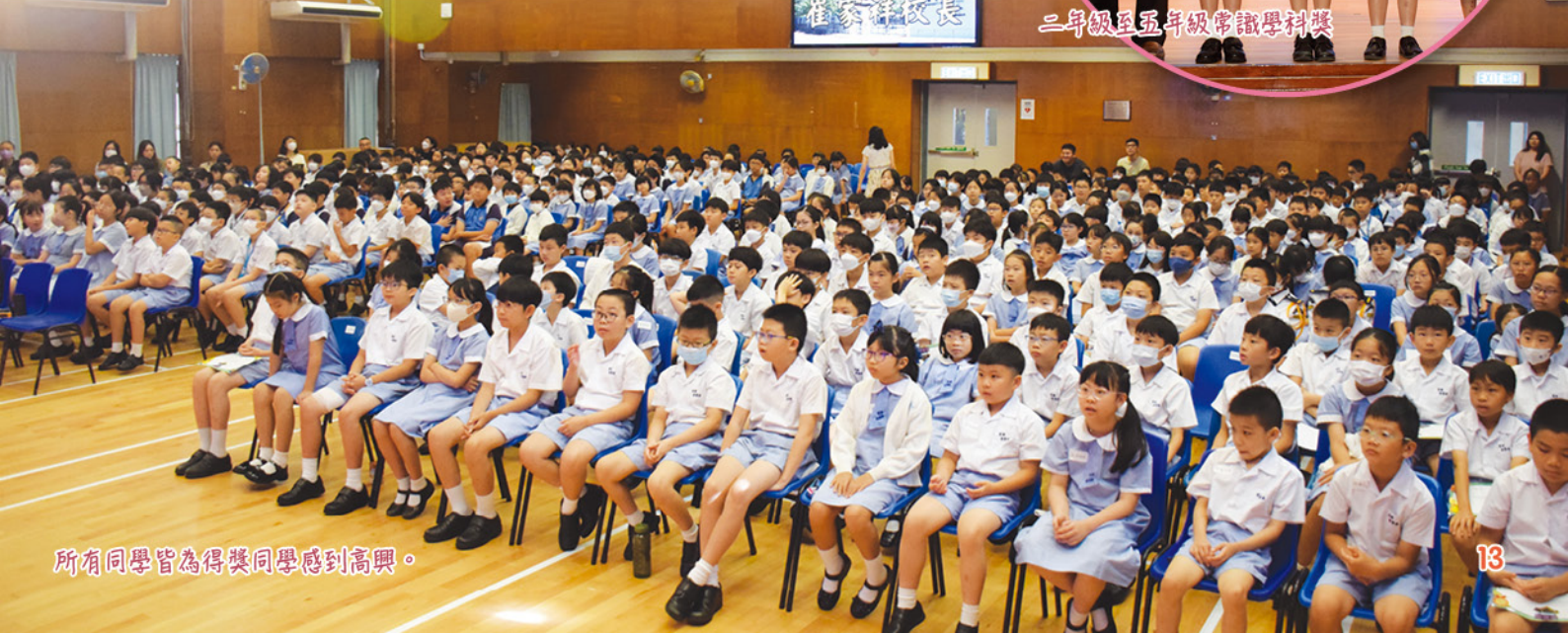
所有同學皆為得獎同學感到高興。