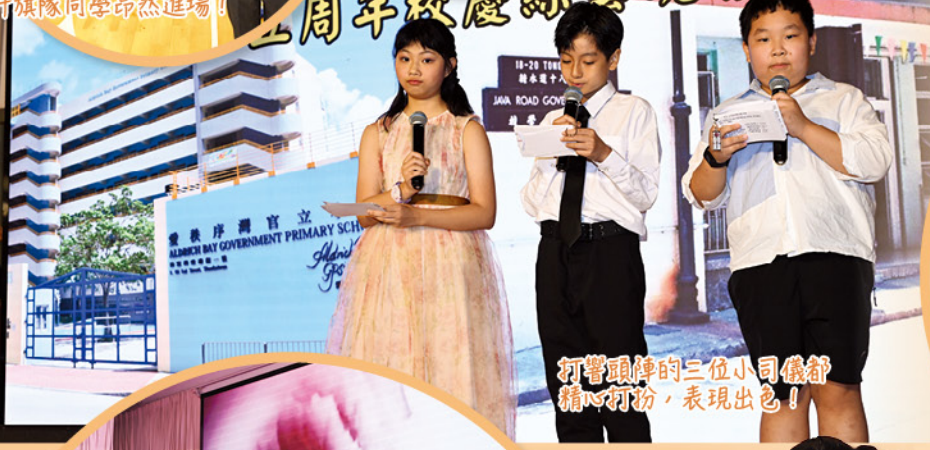
打響頭陣的三位小司儀都精心打扮，表現出色！