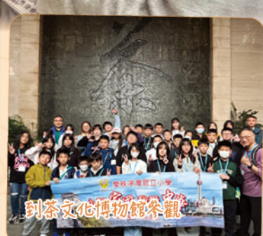
到茶文化博物館參觀