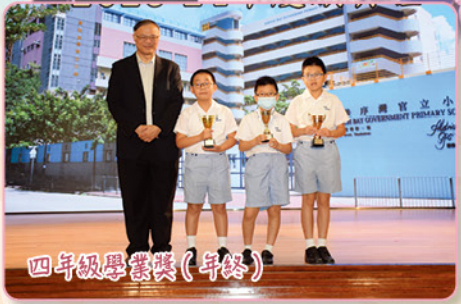
四年級學業獎(年終)