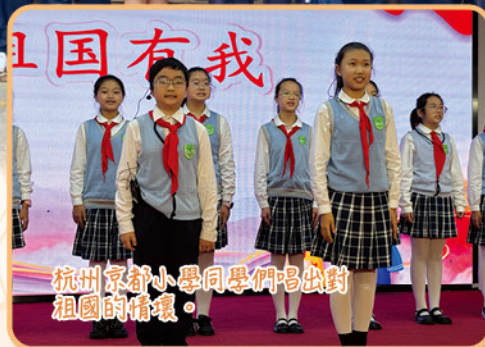
杭州京都小學同學們唱出對祖國的情懷。