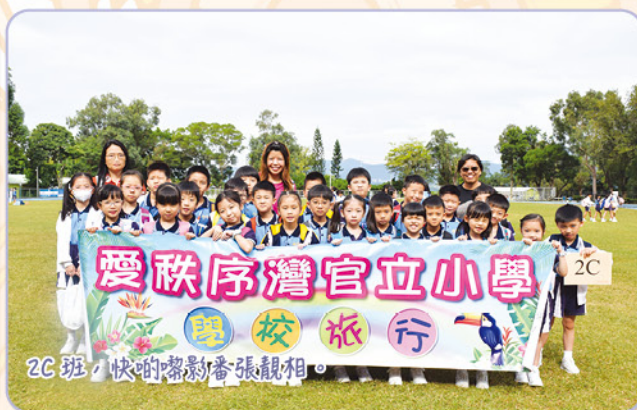
2C班，快啲幫襯番張靚相。