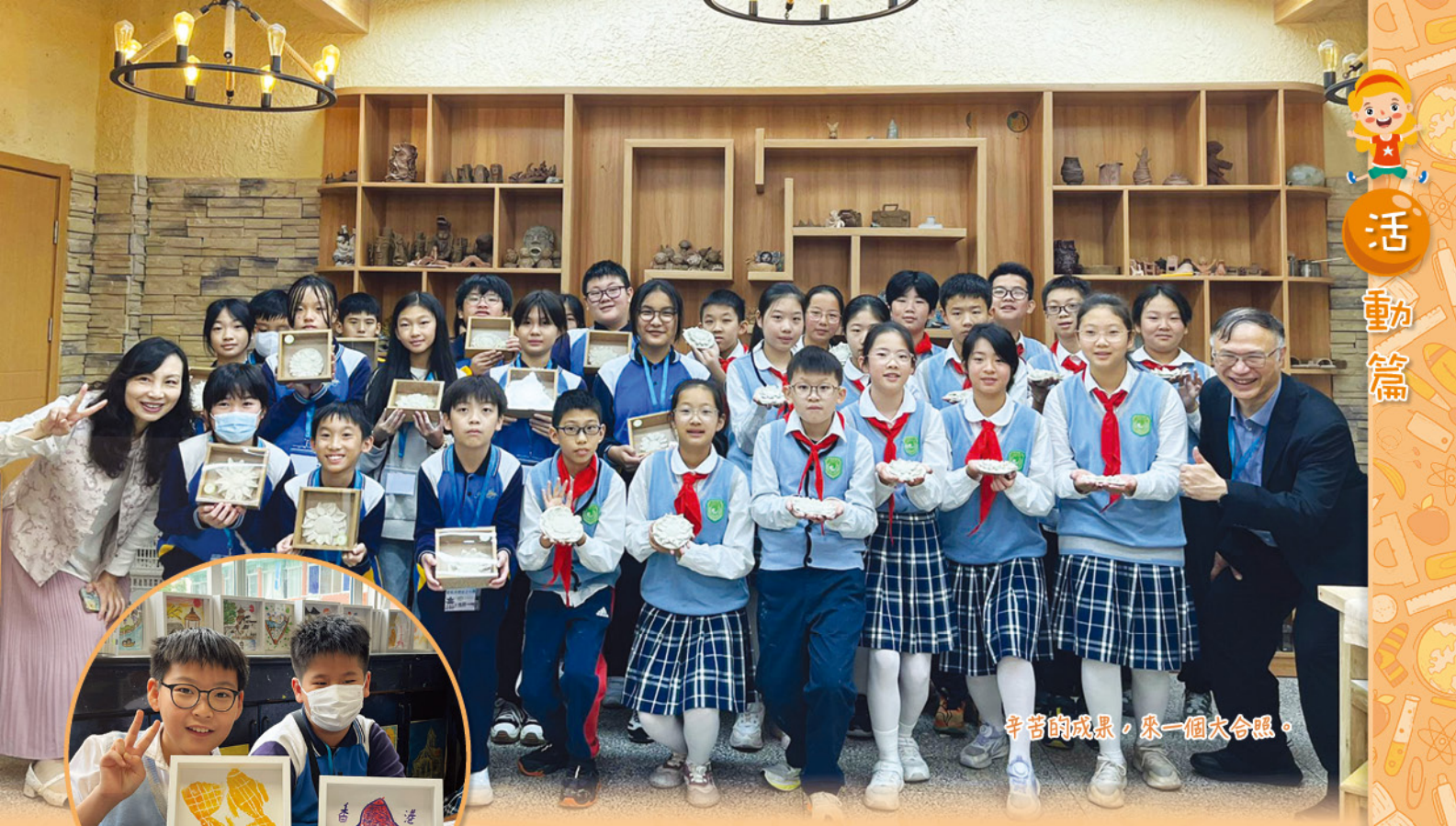
辛苦的成果，來一個大合照。