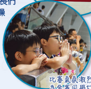
比賽氣氛激烈，同學為參賽同學打氣。