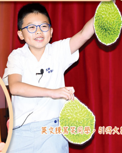
英文棟篤笑同學，引得大家捧腹大笑。