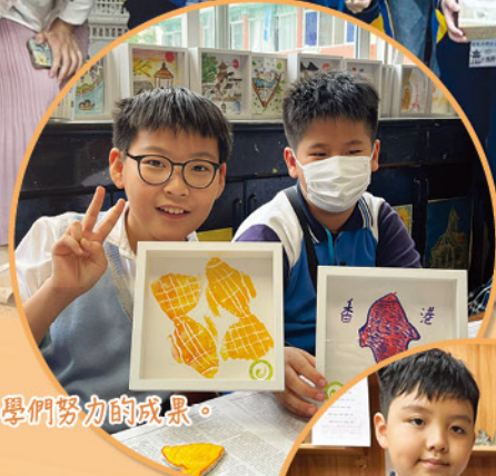
同學們努力的成果。