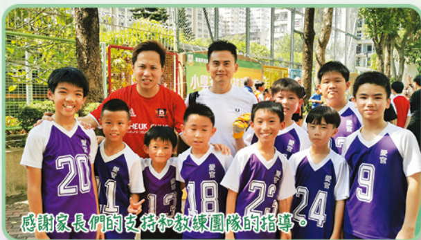
感謝家長們的支持和教練團隊的指導。