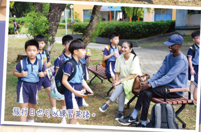
旅行日也可以練習英語。

一年一度的小學旅行在烏溪沙青年新村舉行，一至六年級的學生們一同參與。當天天氣晴朗，陽光明媚，微風拂面，讓人感到舒適愜意。同學們在老師的引領下進行各種活動及遊戲，大家互相合作，建立友誼。這次旅行豐富多彩，讓學生們收穫滿滿，也增進了他們的團隊合作和社交能力。