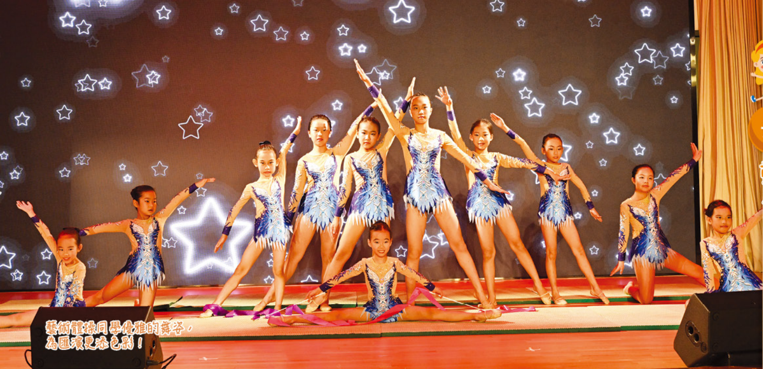
藝術體操同學優雅的舞姿， 為匯演更添色彩！