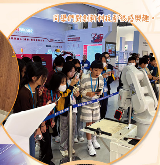
同學們對創新科技都很感興趣。