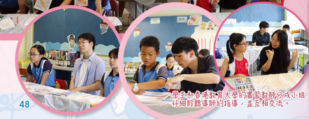
學生和香港教育大學的實習教師分成小組，仔細聆聽導師的指導，並互相交流。