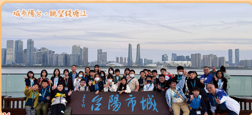
城市陽台，眺望錢塘江