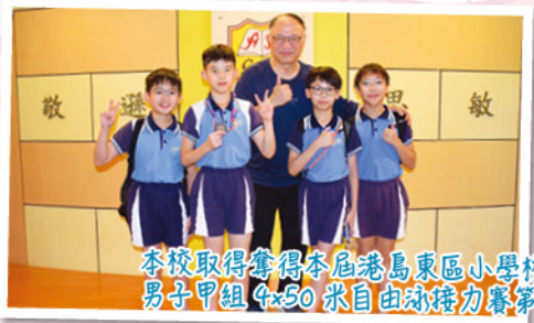
本校取得奪得本屆港島東區小學校際游泳比賽男子甲組 4x50 米自由泳接力賽第 8 名