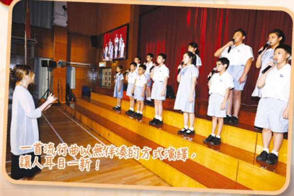
一首流行曲以無伴奏的方式演繹，讓人耳目一新！