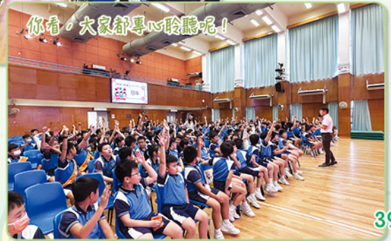
你看，大家都專心聆聽呢！