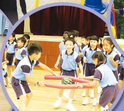
小一小二歷奇活動：小心搬運。