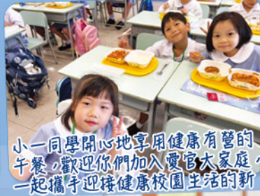
小一同學開心地享用健康有營的午餐，歡迎你們加入愛官大家庭，一起攜手迎接健康校園生活的新頁。