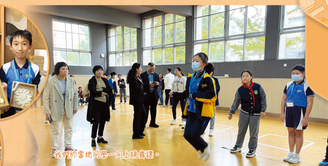
我們於當地同學一同上跳舞課。