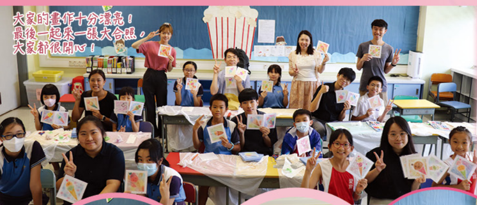
大家的畫作十分漂亮！最後一起來一張大合照，大家都很开心！

在七月份，本校與香港教育大學合作，舉辦和諧粉彩工作坊，讓學生透過心靈療癒的繪畫活動，舒緩情緒。