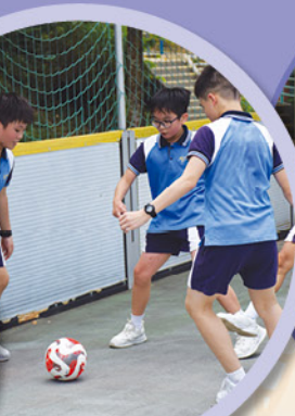
我準備踢入龍門啦！