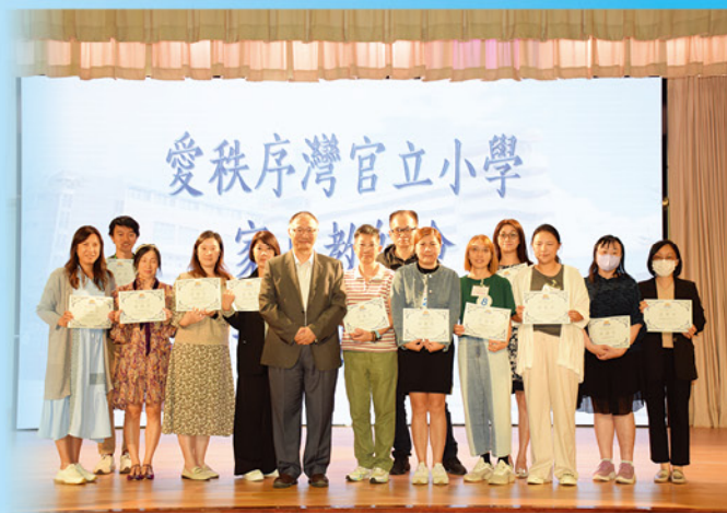
為了表示謝意，崔校長致送感謝狀予第二十四屆家長教師會委員。