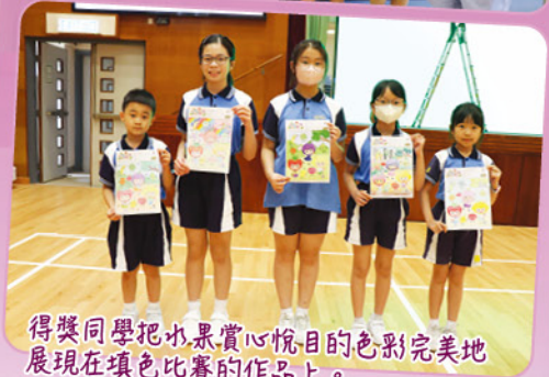
得獎同學把水果賞心悅目的色彩完美地展現在填色比賽的作品上。