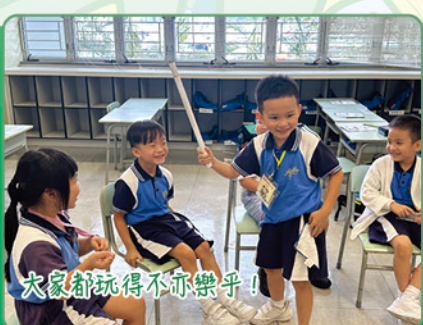
大家都玩得不亦樂乎！