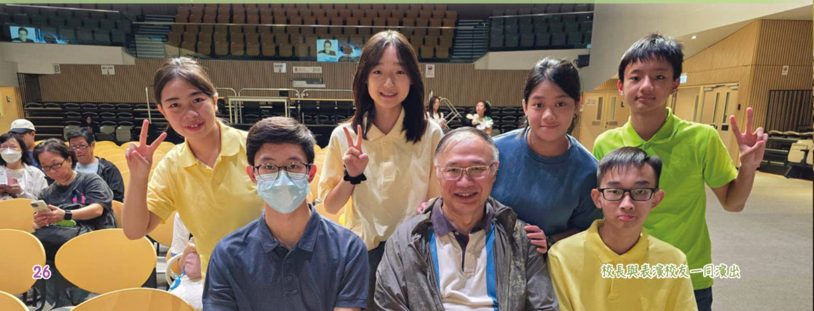
校長與表演校友一同演出