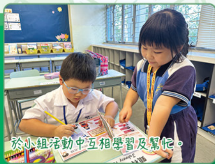
於小組活動中互相學習及幫忙。