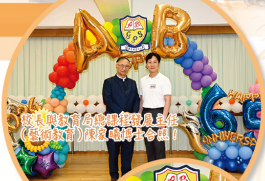
校長與教育局總課程發展主任（藝術教育）陳家曦博士合照！

二零二四年七月五日（星期五），全校師生懷着激動的心情迎來了「愛秩序灣渣華道官小 65 周年校慶綜藝匯演」。當晚匯演匯聚了各種形式的表演，當中包括舞蹈、音樂、棟篤笑、特別嘉賓演出等，展現出本校學生的多元化及藝術才能。本次匯演不僅是一場視覺及聽覺的饗宴，更是一場扣動人心、精彩絕倫的演出！