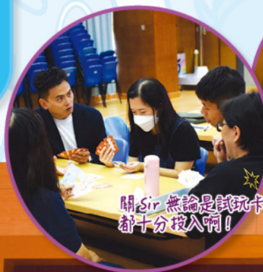
關sir 無論是試玩卡牌或是製作花燈，都十分投入啊！