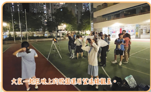
大家一起在晚上的校園運用望遠鏡觀星。