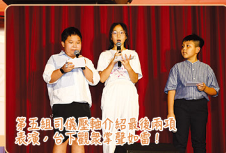
第五組司儀歷軸介紹最後兩項 表演，台下觀眾掌聲如雷！