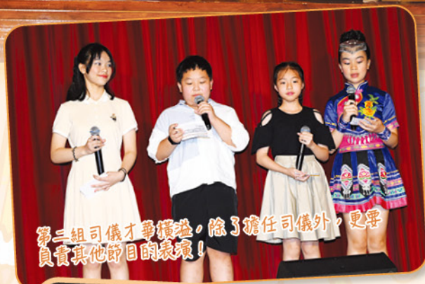
第二組司儀才華橫溢，除了擔任司儀外，更要負責其他節目的表演！