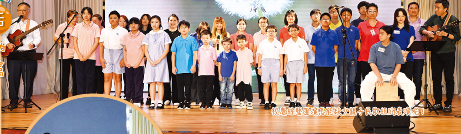
校慶綜藝匯演怎能缺少親子民歌組的表演呢！