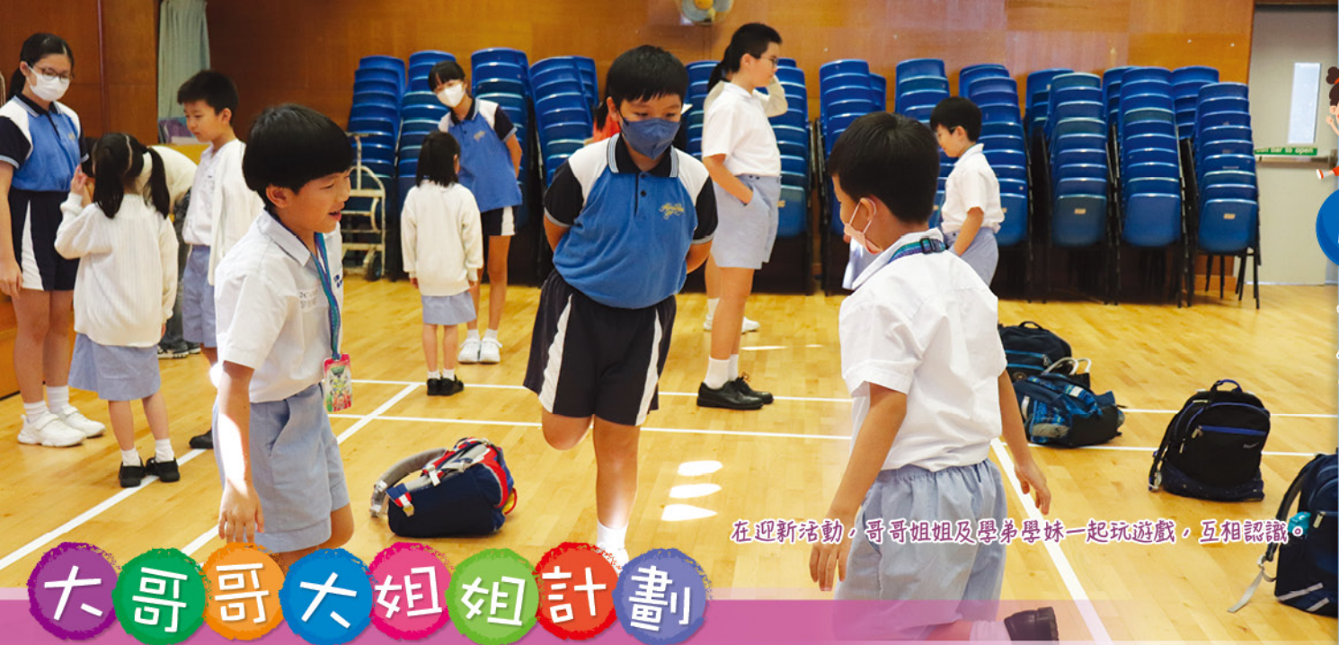
在迎新活動，哥哥姐姐及學弟學妹一起玩遊戲，互相認識。