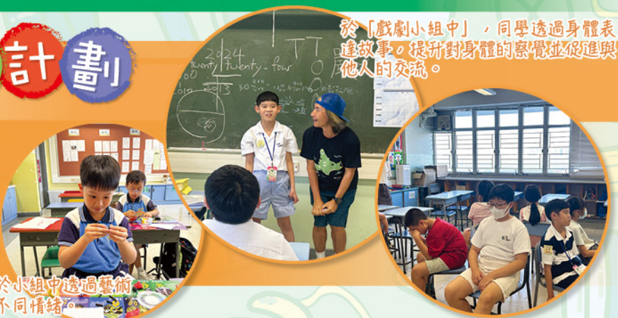
於「戲劇小組中」，同學透過身體表達故事，提升對身體的察覺並促進與他人的交流。

本年度參與了由循道愛華村服務中心社會福利部舉辦的非「童」凡響計劃，透過小組、挑戰營、家長小組、親子活動等提高學生的溝通能力、情緒表達，以及與家長的親職技巧，一起看看進行了甚麼活動吧！