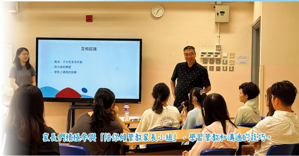
家長們積極參與「陪你傾管教家長小組」，學習管教和溝通的技巧。

學校於本年度繼續推行「家長學院」獎勵計劃，有系統地讓家長持續學習，提升父母的親職教育能力，加強親子關係，營造愉快的家庭生活。「家長學院」的活動範疇包括：家長講座、家長工作坊及親子活動等。學校會根據家長參與活動的積點數量，向家長頒發金獎、銀獎或銅獎。學校於上學期共舉辦了四次網上家長講座、一次實體家長講座、兩次家長小組活動及三次家長午間放鬆工作坊，家長皆非常積極參與。