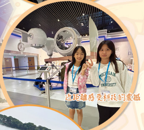
近距離感受科技的震撼