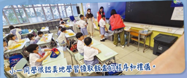
小一同學很認真地學習領取飯盒的程序和禮儀。