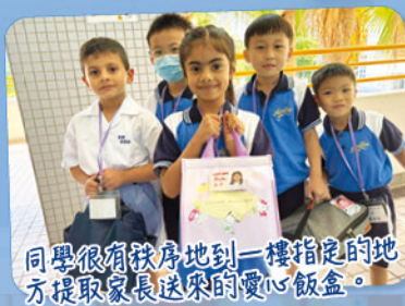
同學很有秩序地到一樓指定的地方提取家長送來的愛心飯盒。