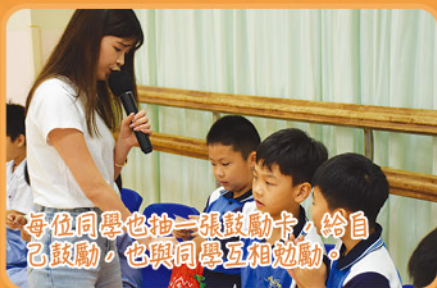
每位同學也抽一張鼓勵卡，給自己鼓勵，也與同學互相勉勵。