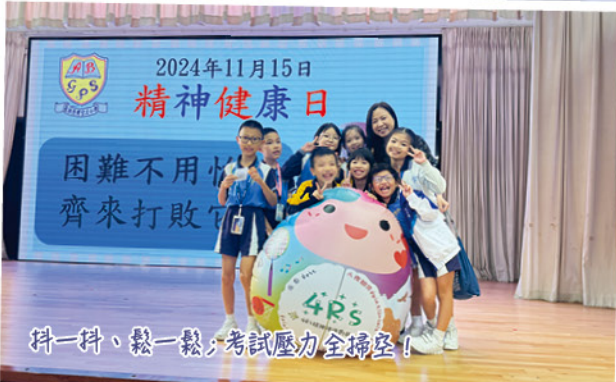
抖一抖、鬆一鬆，考試壓力全掃空!