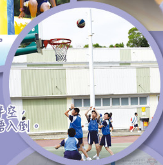
籃球在半空，你估入唔入倒。