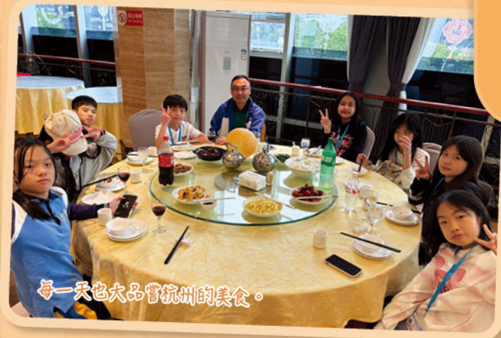
每一天也大品嚐杭州的美食。