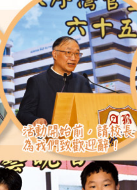
活動開始前，請校長為我們致歡迎辭！