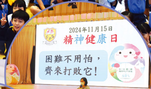
於考試前夕，安排精神健康攤位活動讓同學減壓放鬆。

為加強學生對精神健康的覺察和認識，學校於十一月十五日舉行精神健康攤位活動，讓學生透過遊戲的形式加強對精神健康的認識、學習處理壓力及正確表達情緒，加強自我關懷的技巧。另外，當天亦派發了「4Rs自我照顧打氣卡」予學生，鞏固其正確處理情緒的方法。