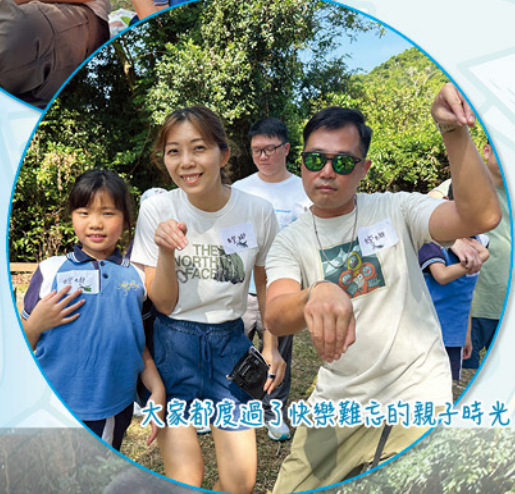
大家都度過了快樂難忘的親子時光！