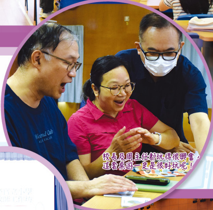
校長及周主任都玩得很興奮，這套桌遊一定是很好玩呢！

八月三十日（星期五）是愛官的第一次教師專業發展日，主題是「中華文化」。教師發展日分兩個環節，第一個環節是「中華飲食文化」，老師會體驗如何使用桌上遊戲來進行學習；第二個環節是「非遺教師工作坊」，導師教導老師們製作傳統花燈，老師能親身體驗製作工藝的精妙，及明白承傳中國傳統文化的重要。