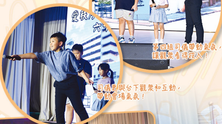
第四組司儀帶動氣氛，讓觀眾看得投入！