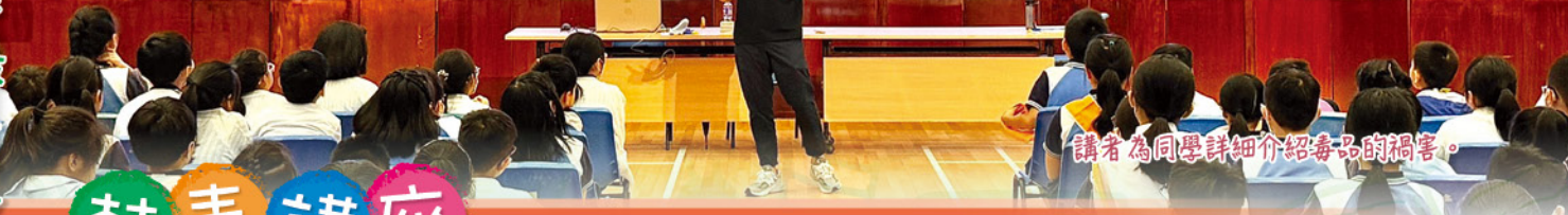
講者為同學詳細介紹毒品的禍害。