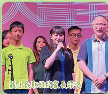
親子民歌組的家長領唱