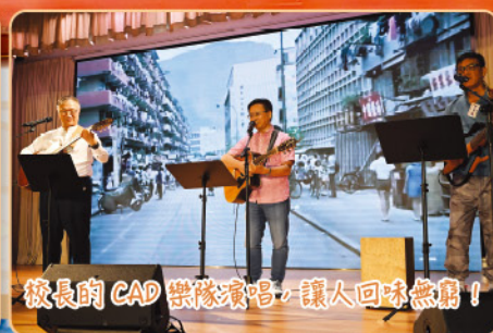
校長的 CAD 樂隊演唱，讓人回味無窮！