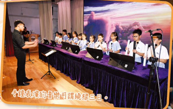
6 鐘表演的音樂可謂繞樑三日。