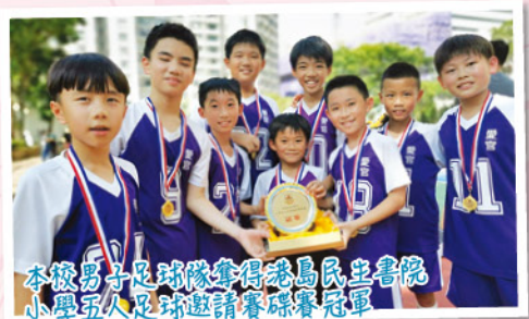
本校男子足球隊奪得港島民生書院小學五人足球邀請賽碟賽冠軍