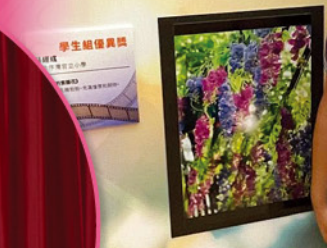
5B 蔡經彧作品—《驕陽下的紫藤花》