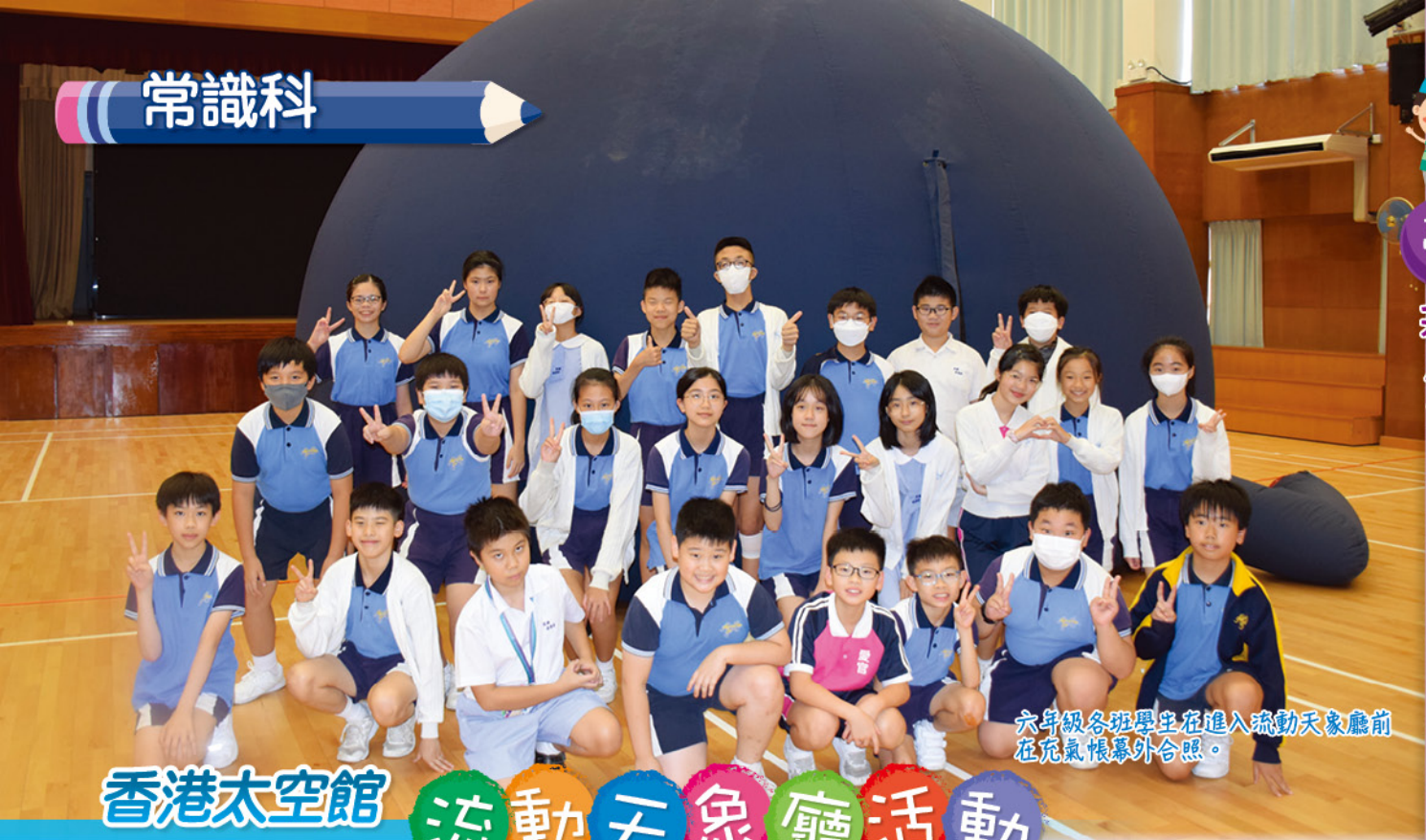
六年級各班學生在進入流動天象廳前在充氣帳幕外合照。