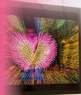
學生組冠軍 羅傲懿 作品：《心花怒放》

6B 馮焯琳於關愛動員主辦的「東區兒童繪畫創作比賽 2024 — 以愛燃亮生命」榮獲兒童組季軍。