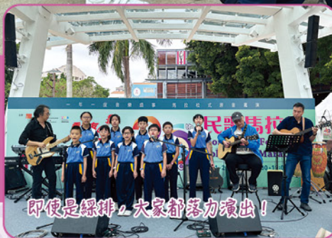
即使是綠排，大家都落力演出！