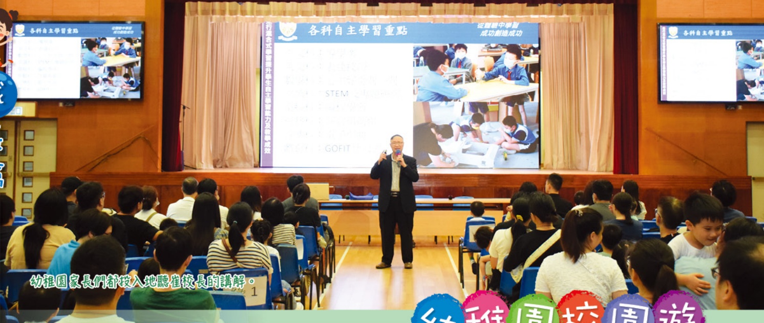
幼稚園家長們都投入地聽崔校長的講解。