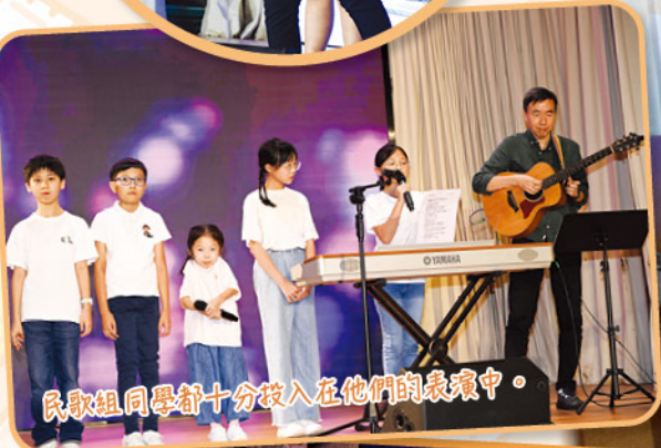
民歌組同學都十分投入在他們的表演中。