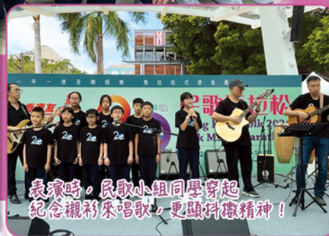
表演時，民歌小組同學穿起紀念襯衫來唱歌，更顯科微精神！