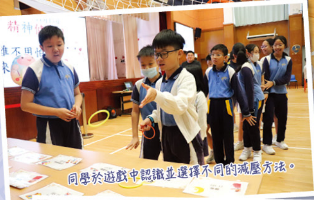
同學於遊戲中認識並選擇不同的減壓方法。