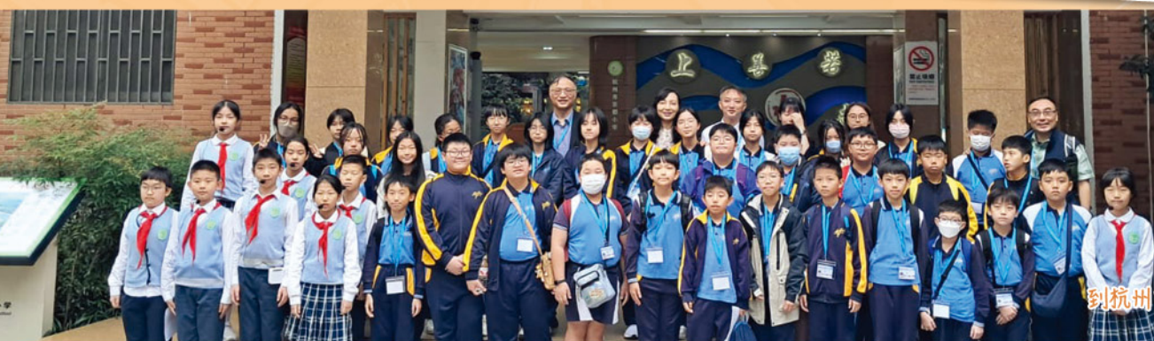
到杭州京都小學訪問。