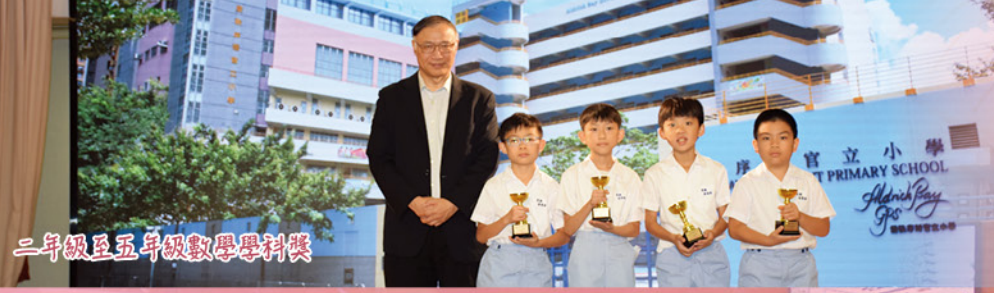
二年級至五年級數學學科獎