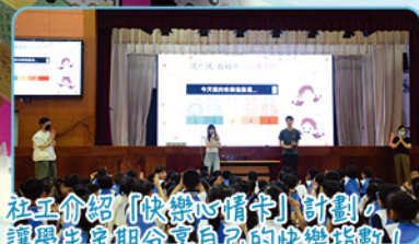
社工介紹「快樂心情卡」計劃，讓學生定期分享自己的快樂指數！