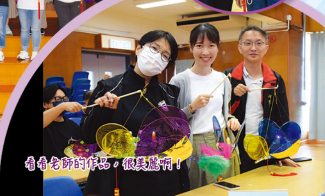
看看老師的作品，很美麗啊！