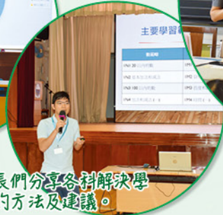
科主任向家長們分享各科解決學生學習難點的方法及建議。