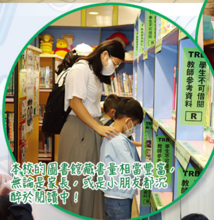
本校的圖書館藏書量相當豐富，無論是家長，或是小朋友都沉醉於閱讀中！