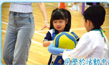
同學於活動中進行「快樂運球」。