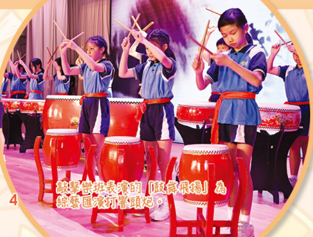
敲擊樂班表演的「鼓聲飛揚」為綜藝匯演打響頭炮。