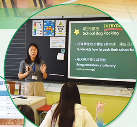
班主任向家長們分享學生的學習情況。