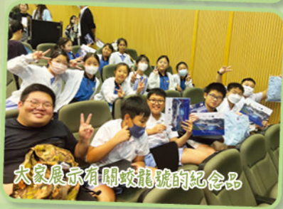
大家展示有關蛟龍號的紀念品