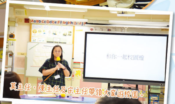
莫主任、陳主任及梁主任帶領大家遊校園。