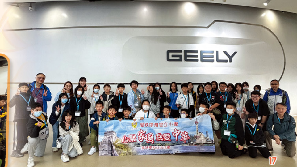
我們到吉利汽車參觀。