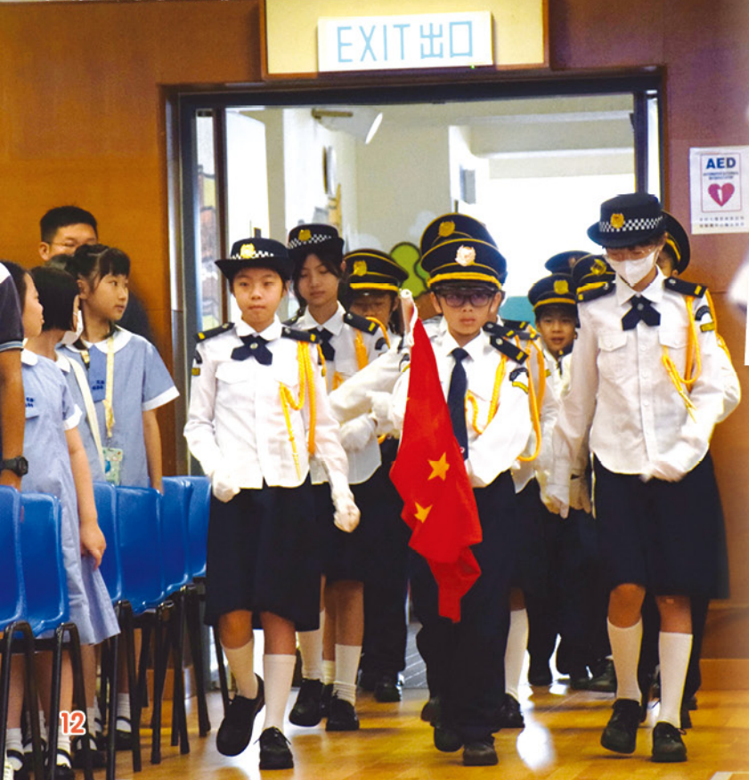
升旗隊雄赳赳地進場！