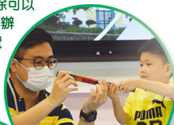
小朋友對科學探究也有濃厚的興趣！

本校於二零二四年九月二十一日（星期六）舉辦了幼稚園校園遊，目的是讓區內外的幼稚園生及家長對本校有更深入的认识。當天的盛況空前，接近200個家庭報名參加。家長除可以透過參加簡介會認識本校的辦學理念外，學生更可以遊覽本校各項設施和參與我們的體驗活動，從而了解學校的環境和特色課程。