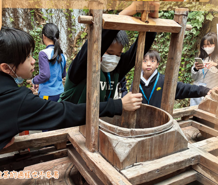
造茶的過程也不容易