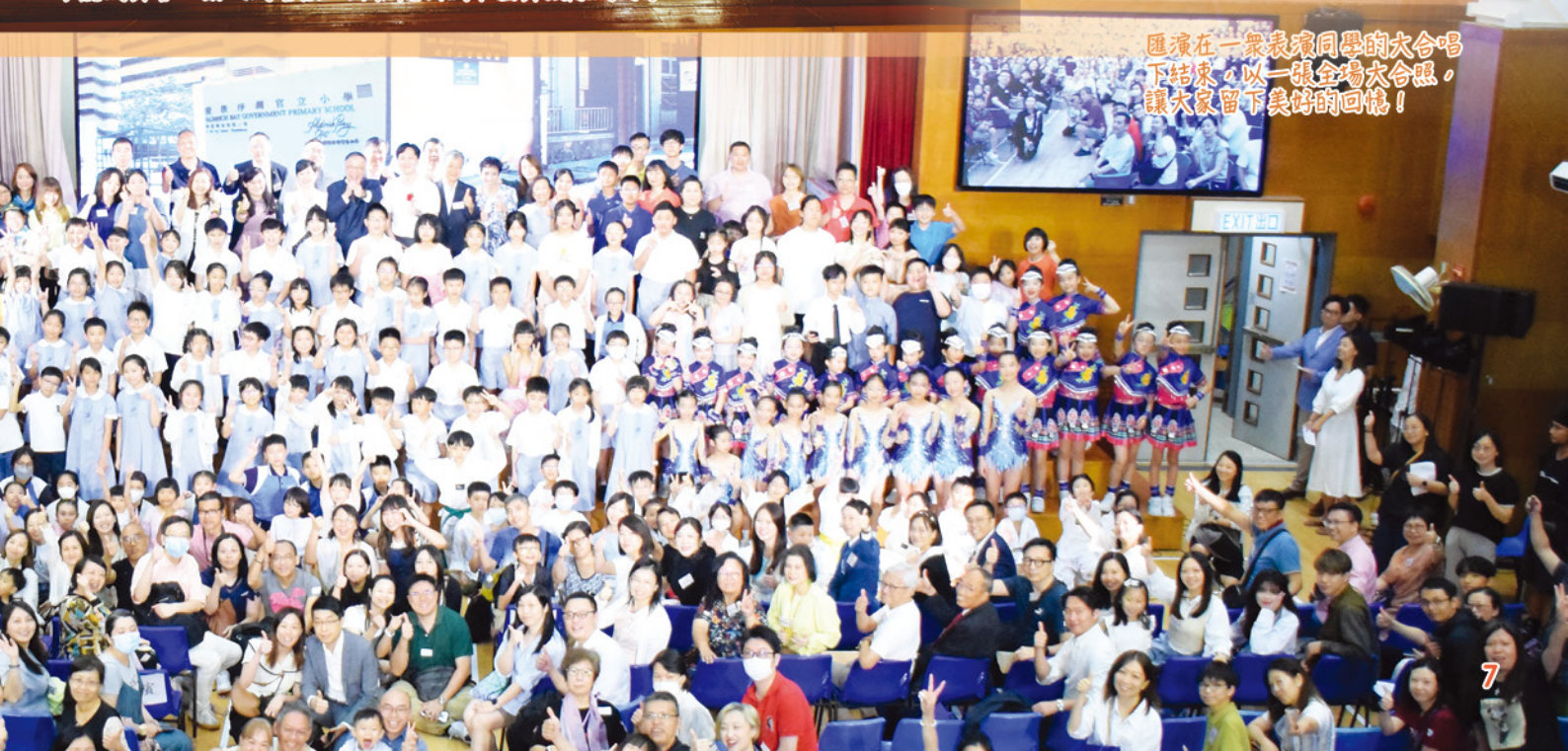
匯演在一眾表演同學的大合唱 下結束，以一張全場大合照， 讓大家留下美好的回憶！