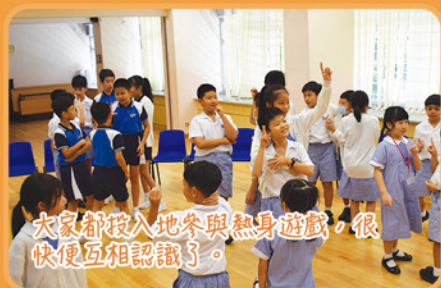
大家都投入地參與熱身遊戲，很快便互相認識了。

為了協助插班生適應新的校園生活，本年度舉辦了插班生適應活動，除了歡迎新同學加入愛官大家庭之外，還透過遊戲讓同學互相認識，彼此守望相助，並且讓同學知道，在有需要時，老師和社工們都可以為他們提供適切的支援。