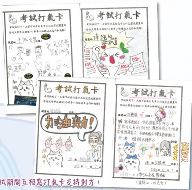
考試期間互相寫打氣卡支持對方！

大哥哥大姐姐計劃繼續舉辦！計劃讓六年級的同學成為二年級同學的大哥哥大姐姐，在學校內關心和照顧他們，推廣朋輩互助，建立關愛的校園。