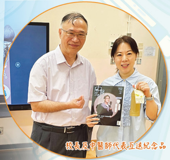
校長及中醫師代表互送紀念品