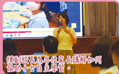
陳副校長為各位家長講解如何協助子女自主學習。