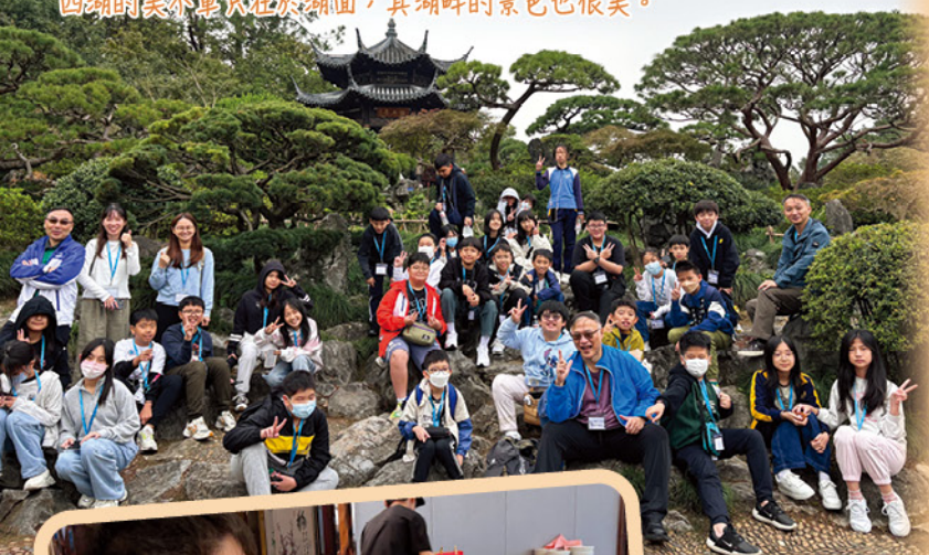
西湖的美不單只在於湖面，其湖畔的景色也很美。