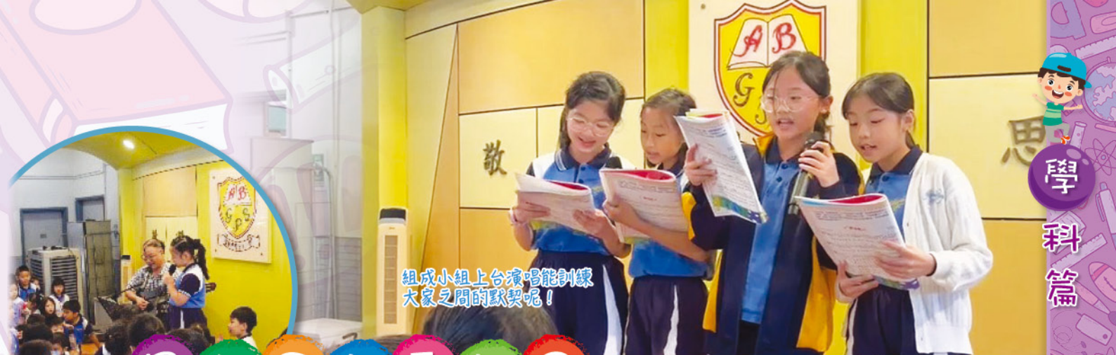
組成小組上台演唱能訓練大家之間的默契呢！