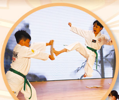
你看！飛腳一踢，木板立即裂開。

當晚司儀班的同學全體出動，務求為各觀眾清晰介紹不同項目的表演節目，各小司儀表現出色，令人驚喜，他們的主持技巧及表達能力，都引起台下觀眾熱烈的掌聲及笑聲，讓整個匯演畫龍點睛，更帶動了台下觀眾的氣氛，他們的表現不僅是對同學們努力的肯定，也為其他同學樹立榜樣，祝福同學們在他們人生的舞台，繼續發光發亮！