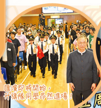
匯演即將開始，升旗隊同學昂然進場！