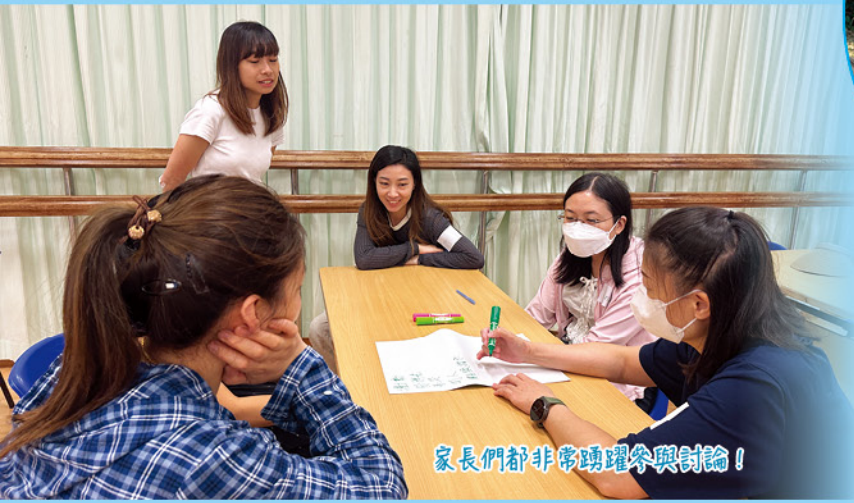
家長們都非常踴躍參與討論！