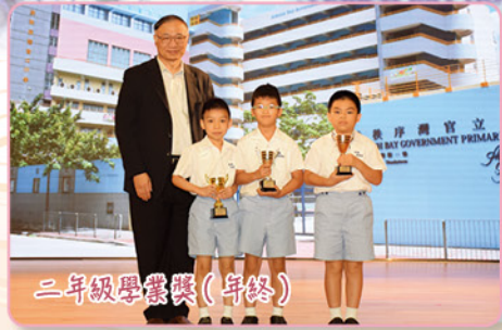
二年級學業獎(年終)