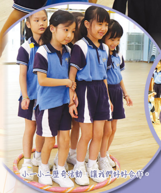
小一小二歷奇活動：讓我們好好合作。