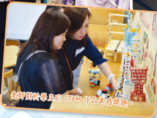
老師對於學生的STEM作品甚感興趣。