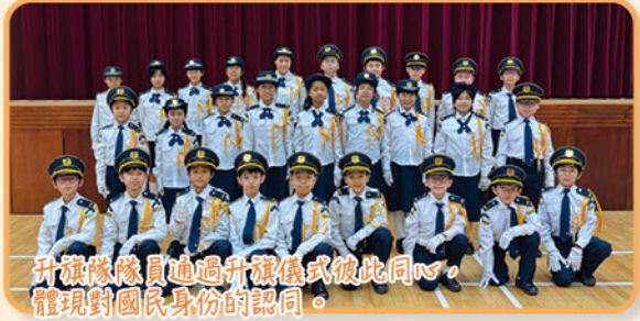
升旗隊隊員通過升旗儀式彼此同心，體現對國民身份的認同。