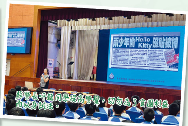
蘇警長呼籲同學提高警覺，切勿為了貪圖利益而以身試法。