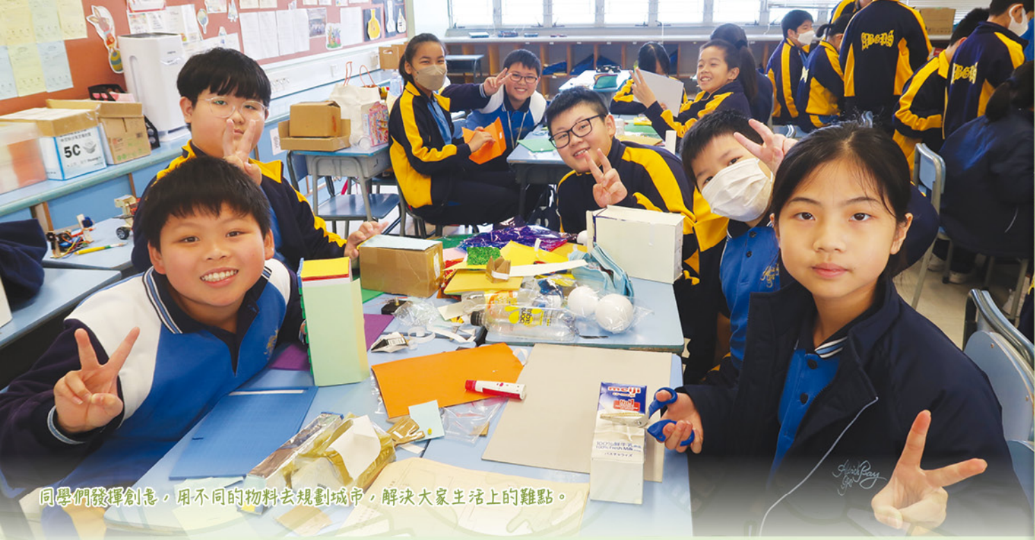
同學們發揮創意，用不同的物料去規劃城市，解決大家生活上的難點。