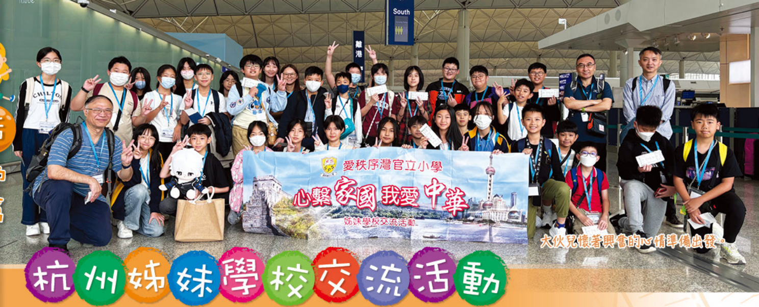
大伙兒懷著興奮的心情準備出發。