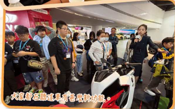
大家都在聽這車有甚麼新功能。