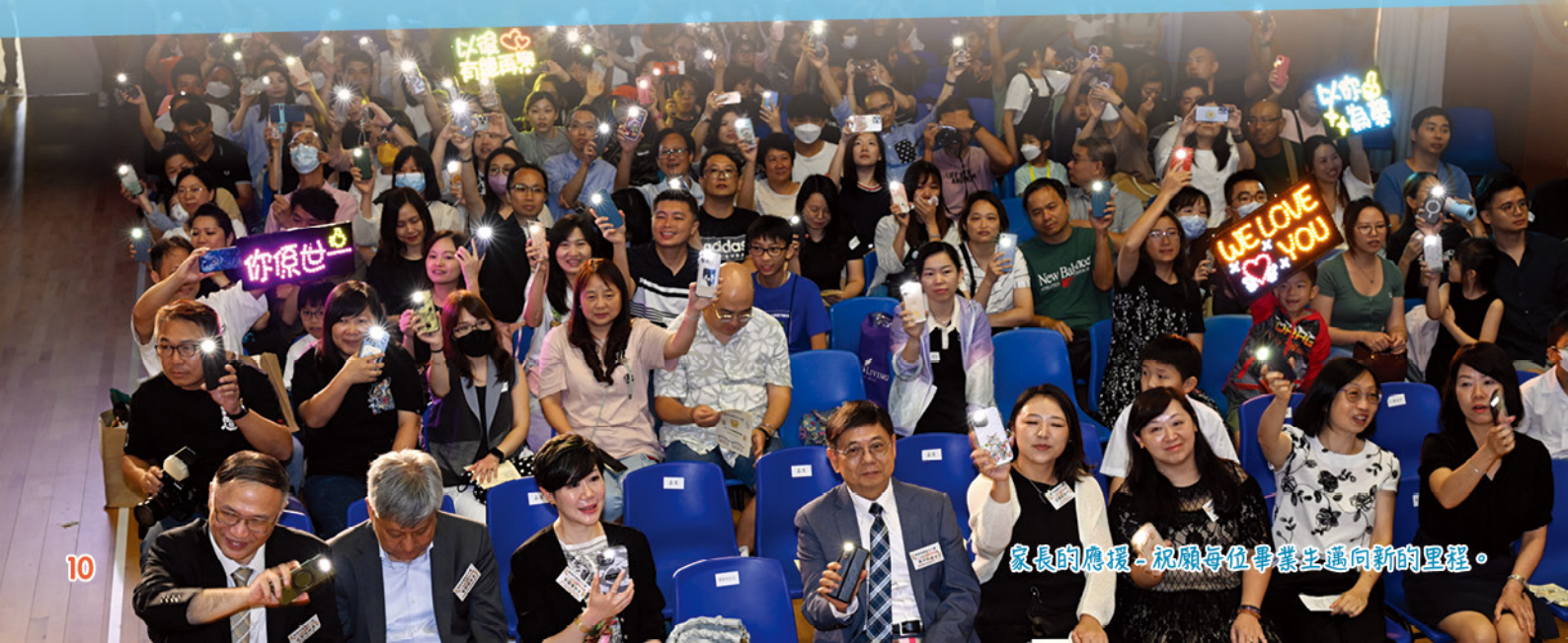
家長的應援-祝願每位畢業生邁向新的里程。