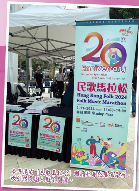
本年度的「民歌馬拉松」繼續在赤柱廣場舉行，吸引很多遊人駐足觀賞。