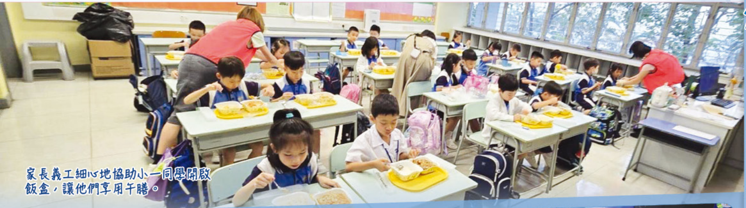
家長義工細心地協助小一同學開啟飯盒，讓他們享用午膳。

本學年九月九日（星期一）是全日制首天，學校邀請家長教師會派出家長義工協助小一同學在校午膳。家長義工除了協助班主任派發飯盒及教導同學領取家長送來的愛心飯盒外，也會教導小朋友學會照顧自己及用膳禮儀，校長和老師看到他們笑著享用午膳，秩序良好，真的令人感到高興。